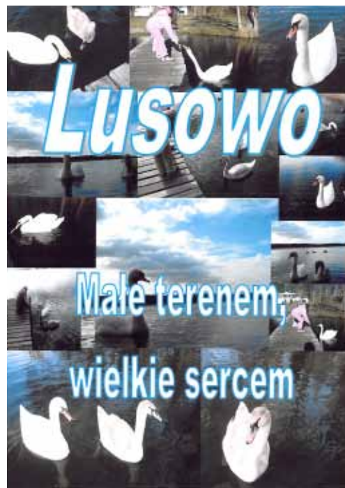
Okładki najlepszych prac w tegorocznej – IV edycji konkursu