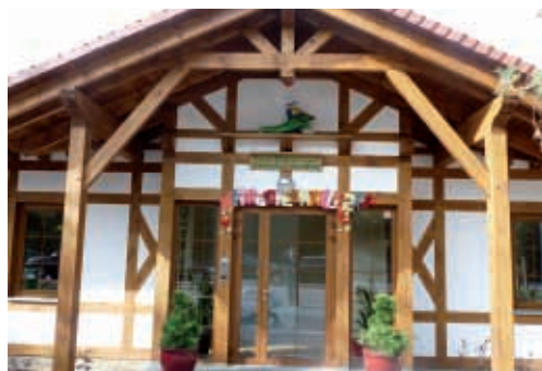
Żłobek „Pod Zielonym Jamniczkiem”

Przez pierwsze dwa lata korzystanie ze żłobka „Pod Zielonym Jamniczkiem” będzie dla rodziców bezpłatne. Jest to możliwe m.in. dzięki temu, że ośrodek pozyskał dofinansowanie w wysokości pół miliona euro ze środków Unii Europejskiej w ramach Euro-