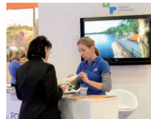
Przygotowane materiały informacyjne, mapy i przewodniki były wręcz rozchwytywane