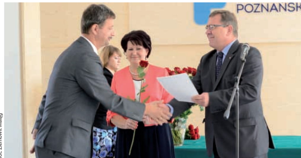
Wyróżniający się dyrektorzy i nauczyciele otrzymali z rąk Starosty Poznańskiego gratulacje i nagrody finansowe