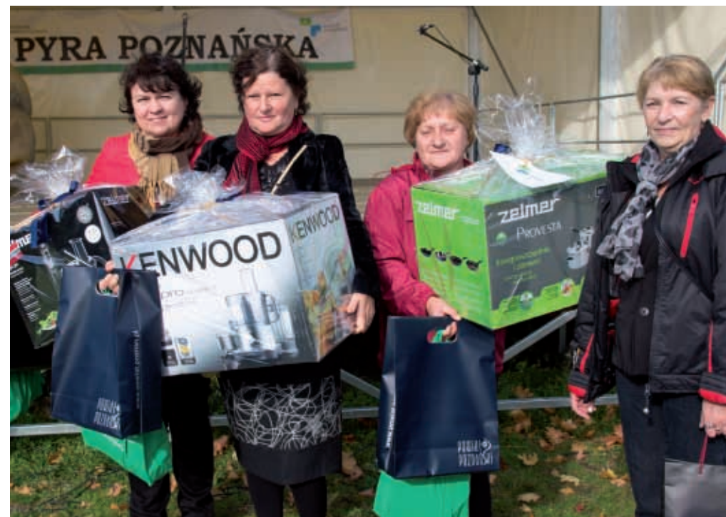
Laureatki konkursu na najlepszego bambrozka

W ramach imprezy „Pyra Poznańska” odbył się konkurs kulinarny na najlepszy bambrozek. Miał on na celu przywrócić pamięć o placku ziemniaczanym, wypiekany na blasze, zwanym w Wielkopolsce bambroz-