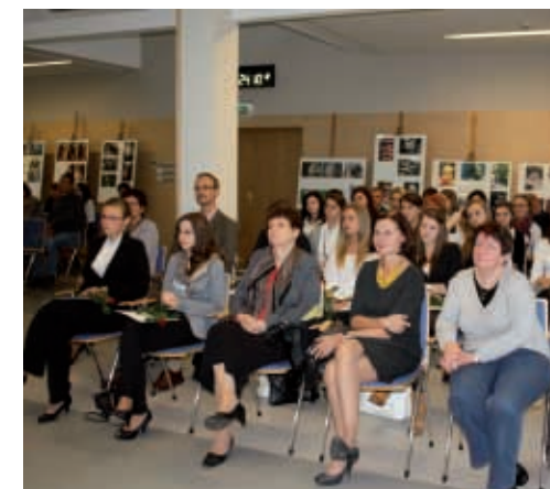
Stypendyści z Zespołu Szkół w Kórniku

co roku laureatom konkursów i olimpiad szczebla krajowego i międzynarodowego. W tym roku nagrodzeni zostali uczniowie Zespołu Szkół nr 1 im. Powstańców Wielkopolskich w Swarzędzu, Zespołu Szkół nr 2 w Swarzędzu oraz Zespołu Szkół im. Gen. Dezyderego Chłapowskiego w Bolecho-