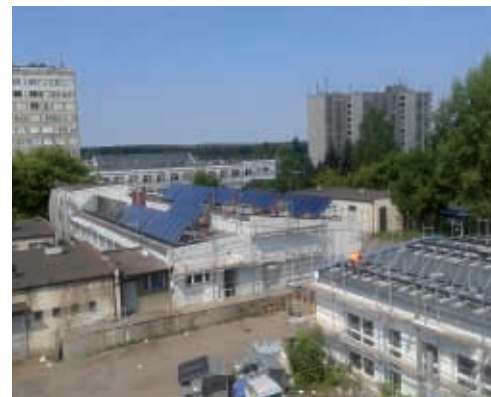
Zainstalowane lampy solarne wspomogą proces ogrzewania wody

grzewczy. Wymieniono już kotły centralnego ogrzewania i podłączono lampy solarne, które wspomogą proces ogrzewania wody.