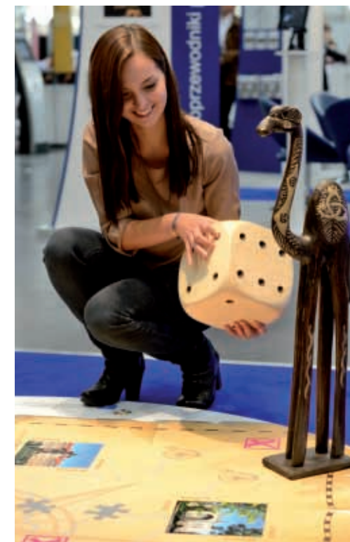
Jedną z atrakcji stoiska była wielkoformatowa gra planszowa Śladami podróżników