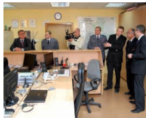
Prezentacja Wydziału Bezpieczeństwa, Zarządzania Kryzysowego i Spraw Obywatelskich Starostwa Powiatowego w Poznaniu