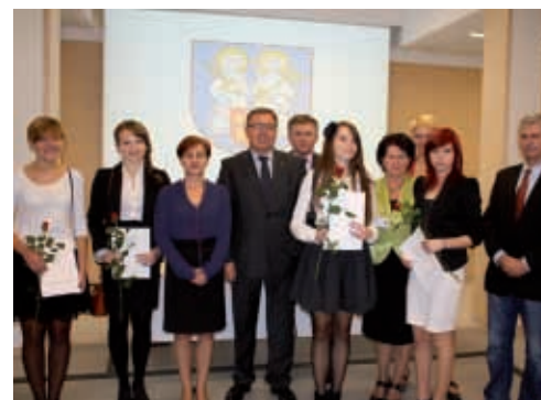
Stypendyści z Zespołu Szkół w Kórniku

go Rady Powiatu, w Poznaniu odebrało 33 uczniów, którzy w poprzednim roku nauki w szkole ponadgimnazjalnej uzyskali średnią ocen minimum 5,0. W nagrodę, przez cały rok szkolny 2012/2013, będą otrzymywać stypendium w wysokości 250 zł miesięcznie. Stypendia Rady Powiatu w Poznaniu wręczone zostały uczniom z: Zespołu Szkół im. gen. Dezyderego Chłapowskiego w Bolechowie, Zespołu Szkół w Kórniku, Zespołu Szkół w Puszczykowie, Zespołu Szkół nr 1