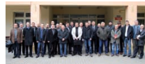
Uczestnicy Szkolenia Obronnego dla inspektorów ds. obronnych gmin Powiatu Poznańskiego

Zajęcia dotyczyły m.in.: zasad realizacji akcji kurierskiej na poziomie gminy i powiatu, ochrony obiektów kultury szczególnie cennych dla dziedzictwa narodowego, ochrony informacji niejawnych, zasad postępowania z dokumentami niejawnymi oraz ich archiwizacji, przemieszczenia organu administracji publicznej do zapasowego miejsca pracy. Uczestnicy zapoznali się również z wybranymi