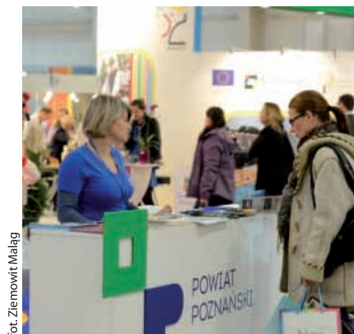
Odwiedzający mogli zaczerpnąć informacji o atrakcyjnej ofercie powiatu