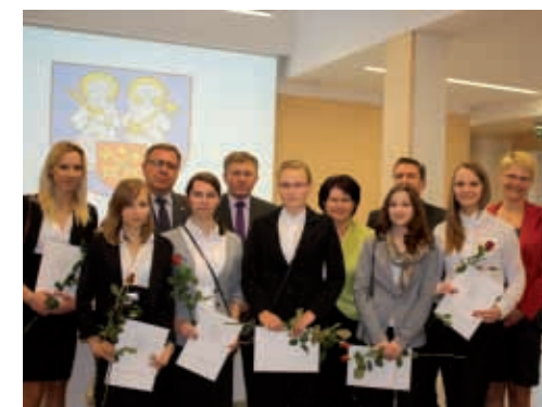
Stypendyści z Zespołu Szkół w Puszczykowie

wie. Nagrodę Starosty Poznańskiego otrzymał także nauczyciel z Zespołu Szkół im. gen. Dezyderego Chłapowskiego w Bolechowie za szczególne osiągnięcia dydaktyczno-wychowawcze.