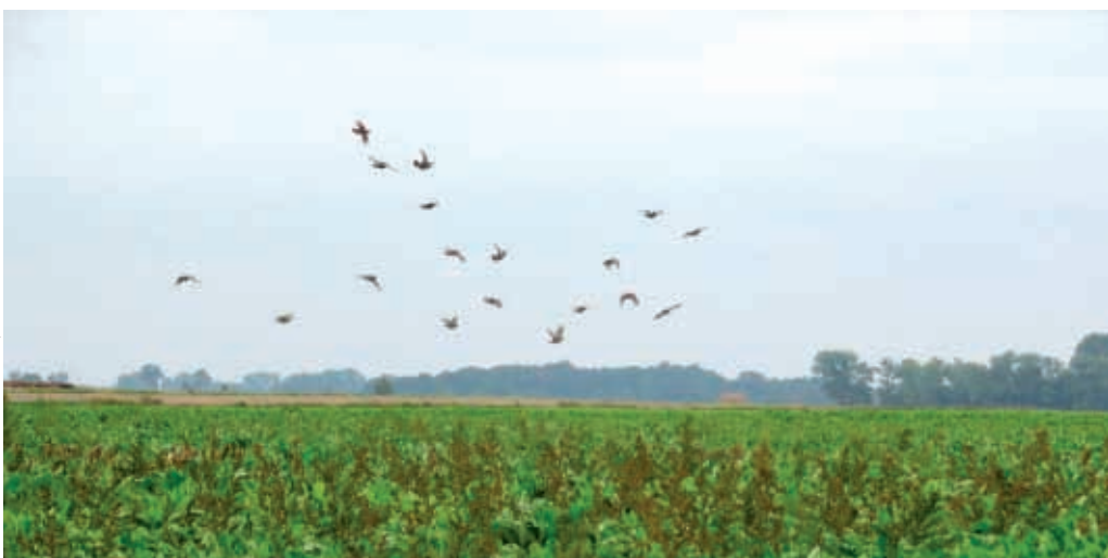
Wypuszczanie kuropatw na terenie Nadleśnictwa Konstantynowo