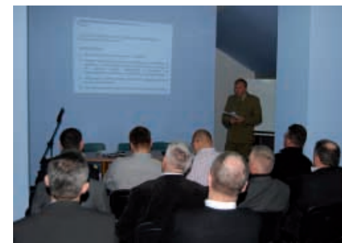
Wykłady dotyczyły m.in. zasad realizacji akcji kurierskiej na poziomie gminy i powiatu

mi elementami planu operacyjnego funkcjonowania Komendy Miejskiej Policji w Poznaniu oraz Komendy Miejskiej Państwowej Straży Pożarnej w Poznaniu w czasie zagrożenia bezpieczeństwa państwa i w czasie wojny, a tak-