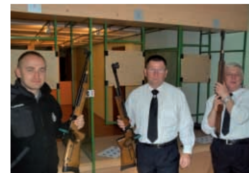
Drużyna OSP Kleszczewo