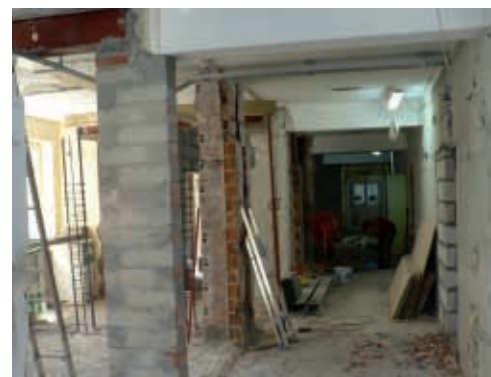
Po gruntownej przebudowie, na parterze powstanie nowe, przestronne Biuro Przyjęć Planowych oraz oddział dzienny medycyny jednego dnia

Wszystko to wiąże się jednak z kosztami rzędu 16 mln. Udało się je uzyskać dzięki staraniom Powiatu Poznańskiego. Złożony przez jego władze wniosek o dofinansowanie prac ze środków Narodowego Funduszu Ochrony Środowiska i Gospodarki Wodnej został rozpatrzony pozytywnie. Drugim źródłem finansowania była pożyczka udzielona Szpitalowi