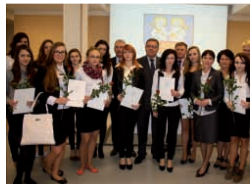
Stypendyści z Zespołu Szkół w Bolechowie

go Rady Powiatu, w Poznaniu odebrało 33 uczniów, którzy w poprzednim roku nauki w szkole ponadgimnazjalnej uzyskali średnią ocen minimum 5,0. W nagrodę, przez cały rok szkolny 2012/2013, będą otrzymywać stypendium w wysokości 250 zł miesięcznie. Stypendia Rady Powiatu w Poznaniu wręczone zostały uczniom z: Zespołu Szkół im. gen. Dezyderego Chłapowskiego w Bolechowie, Zespołu Szkół w Kórniku, Zespołu Szkół w Puszczykowie, Zespołu Szkół nr 1