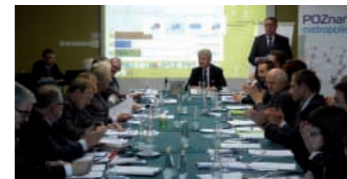
Podczas spotkania wybrano Zarząd Stowarzyszenia na kolejną 4-letnią kadencję

Podczas posiedzenia przyjęto także budżet na przyszły rok oraz omówiono kwestię znaczenia Metropolii Poznań w świetle zapisów