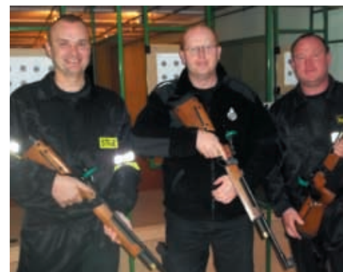
Drużyna OSP Kostrzyn

Zawody zostały przeprowadzone w dniu 13 października br. na terenie strzelnicy w Tulcach. W tegorocznych zawodach wzięło udział 39 zawodników reprezentujących 13 drużyn. Najlepsze drużyny i najlepsi zawodnicy otrzymali nagrody ufundowane przez Jana Grabkowskiego, Starostę Poznańskiego. W imieniu starosty nagrody wręczył Krzysz-