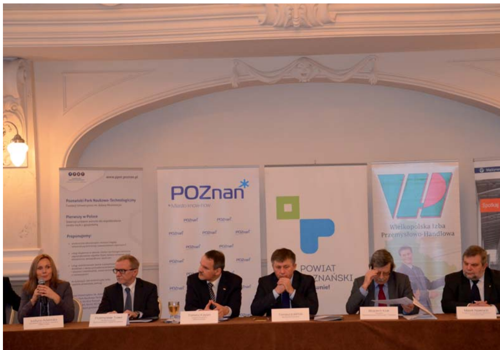
Uroczystość podpisania porozumienia odbyła się w pięknej Sali Białej Hotelu Bazar w Poznaniu

biznesu, jak i współpracownicy gospodarczej w wymiarze lokalnym, regionalnym i międzynarodowym. Poznańskie Dni Przedsiębiorczości służą zatem umacnianiu wizerunku aglomeracji poznańskiej jako przyjaznej wszelkim przejawom aktywności gospodarczej.