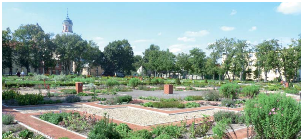
Park Orientacji Przestrzennej w Owińskach jest jedną z najważniejszych inicjatyw Powiatu Poznańskiego, zmierzających do poprawy funkcjonowania osób niewidomych