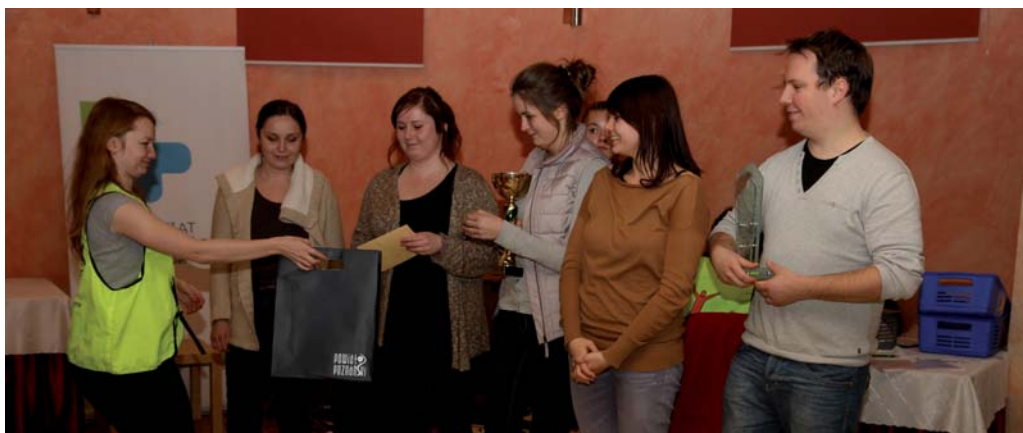
Najlepsi kierowcy otrzymali puchary oraz nagrody