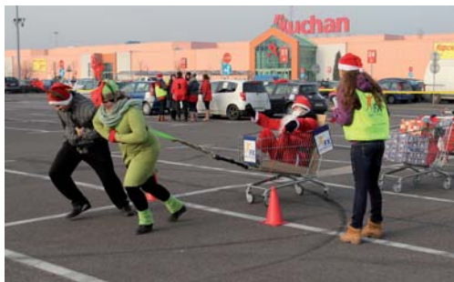
Uczestnicy wcielali się w rolę reniferów, ciągnąc wytyczoną trasą złożony ze sklepowych wózków zaprzęg z prezentami i Świętym Mikołajem

go słońca, po parku biegały Mikołaje i Śnieżynki z mapami, w poszukiwaniu pochowanych punktów.