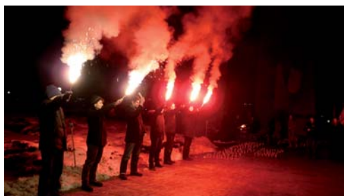
W rocznicę stanu wojennego tradycyjnie już złożono kwiaty pod pomnikiem Poznańskiego Czerwca 1956 r.

Tradycyjnie już złożono kwiaty pod pomnikiem Poznańskiego Czerwca 1956 roku,