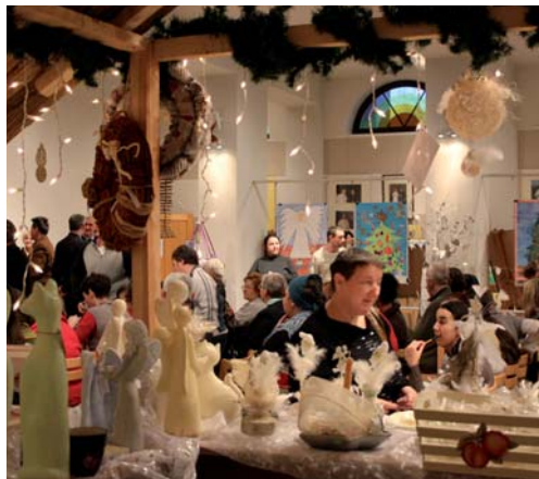
Mimo śnieżnej pogody na wernisażu przybyło wielu gości

Zaprezentowano także mini-antologię pt.: „Drogi Panie nieznajomy”, w której zawarto