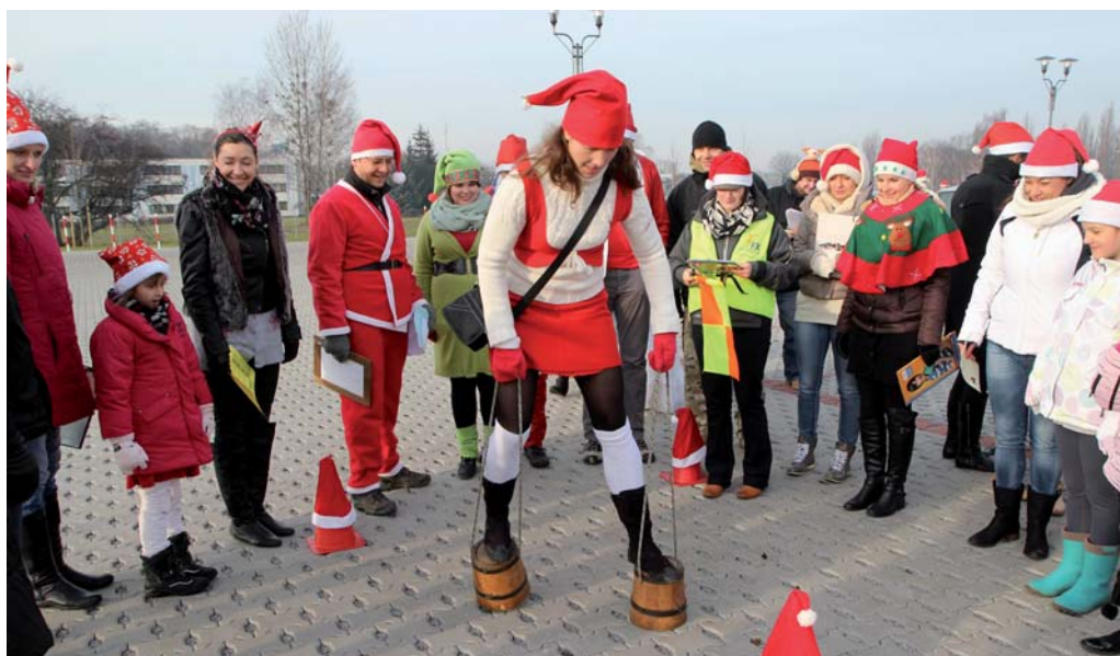
Slalom między pachółkami na specjalnych drewnianych „wiadrochodach”

Pierwszy odcinek rajdu prowadził na poznańską Cytadelę, gdzie odbyły się zabawy oraz bieg na orientację. W blasku południowe-