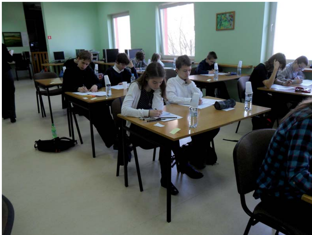
„Złota Żaba” i „Złota Żabka” łączą walory edukacyjne z cechami znakomitej zabawy i rozrywki intelektualnej

kiwaczy niebanalnych dróg rozwiązywania problemów matematycznych. Kto zajrzy do zadań konkursowych, przekona się, że „Złota Żaba” i „Złota Żabka” łączą walory edukacyjne z cechami znakomitej zabawy i rozrywki intelektualnej.