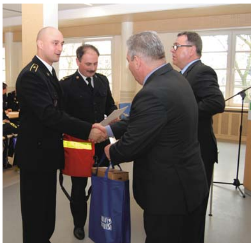
Starosta Poznański i Przewodniczący Rady Powiatu wręczają defibrylatory.

mogącą przywrócić czynność serca w warunkach migotania komór. Defibrylator AED sam analizuje EKG poszkodowanego i wykrywa, kiedy defibrylacja jest wskazana. Zakupione AED posiadają dwufazową metodę, która automatycznie dopasowuje parametry wstrząsu do potrzeb pacjenta. Jeśli pierwszy wstrząs nie przywróci akcji serca, urządzenie podaje na-