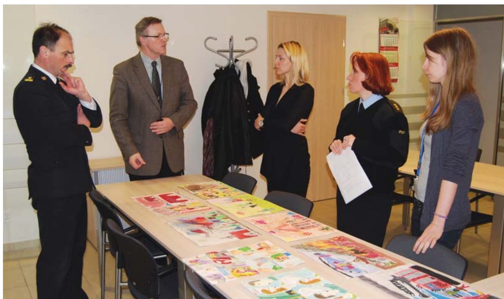
Jury konkursowe podczas oceny najlepszych prac.

Wydział Bezpieczeństwa, Zarządzenia Kryzysowego i Spraw Obywatelskich