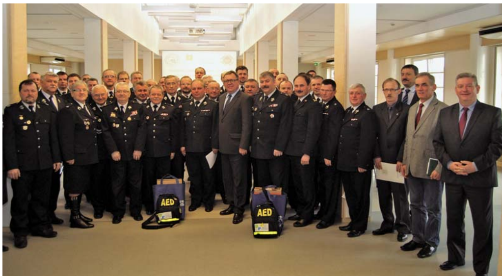
Uroczyste przekazanie odbyło się w Sali Sesyjnej Starostwa Powiatowego w Poznaniu.

Wydział Bezpieczeństwa, Zarządzenia Kryzysowego i Spraw Obywatelskich