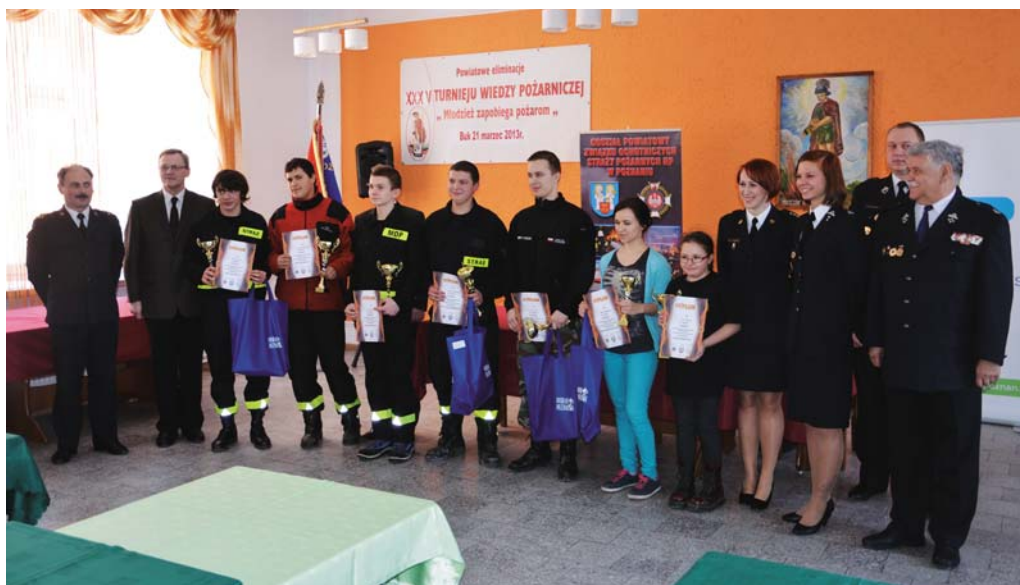
Laureaci powiatowych eliminacji do Ogólnopolskiego Turnieju Wiedzy Pożarniczej Młodzieżowych Drużyn Pożarniczych.

Po pełnych emocji zmaganiach, obejmujących zarówno pisemny test wiedzy pożarniczej oraz odpowiedzi na pytania komisji konkursowej, wyłoniono zwycięzców poszczególnych grup wiekowych: