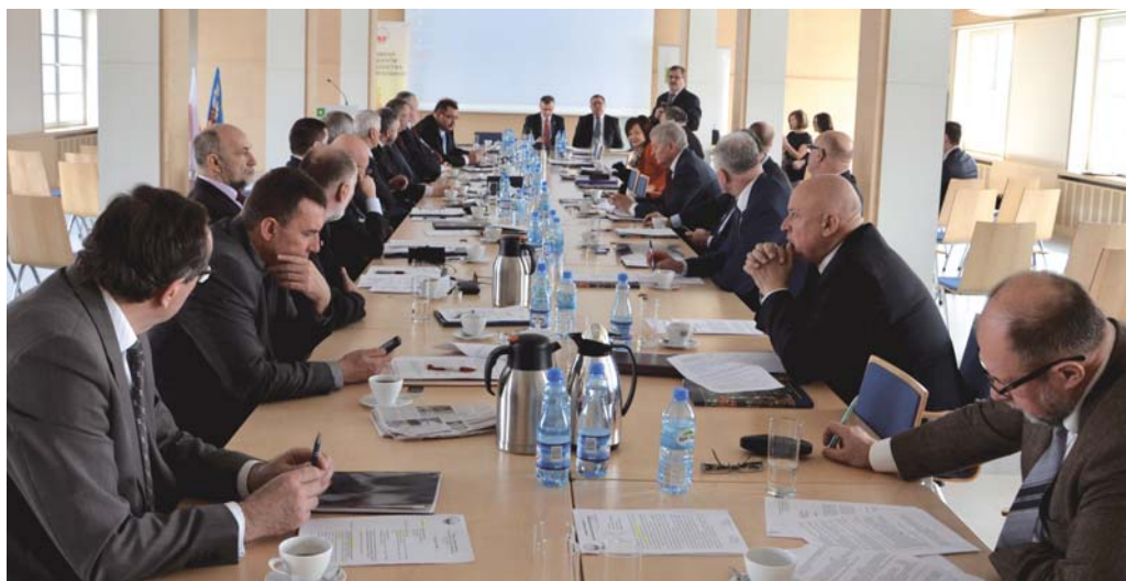
Marcowe posiedzenie Konwentu Starostów odbyło się w Starostwie Powiatowym w Poznaniu.