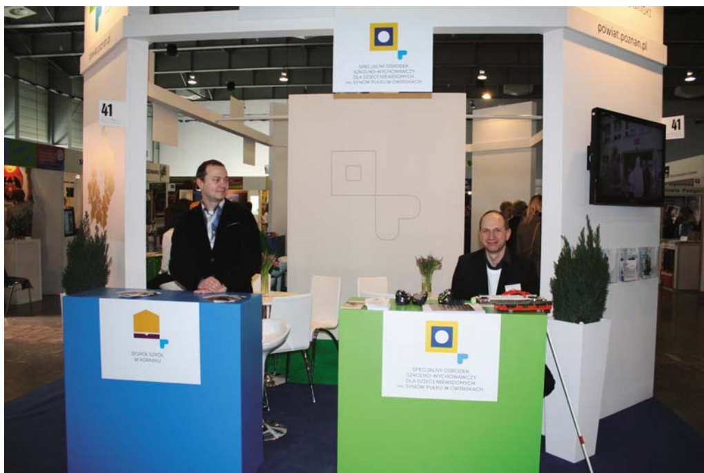
Dokładnych informacji na temat szkolnej oferty udzielali obecni na stoisku nauczyciele.