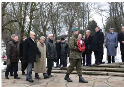
Na uroczystości pojawili się również przedstawiciele korpusu dyplomatycznego.