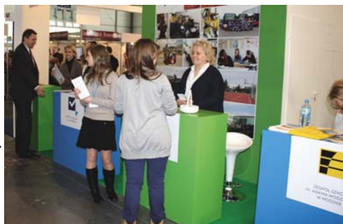
O atmosferze i dobrych warunkach nauki opowiadali uczniowie rozdający ulotki i materiały reklamowe.

zaprojektowanym stoisku. Na zainstalowanych telewizorach można było obejrzeć spoty reklamowe szkół, a dokładnych informacji na temat szkolnej oferty udzielali obecni na stoisku nauczyciele. O atmosferze i dobrych warunkach nauki opowiadali uczniowie, rozdający ulotki i materiały reklamowe, zachęcające do wyboru poszczególnych szkół. Szkoły Powiatu Poznańskiego mają rozbudowaną ofertę zarówno w zakresie kształcenia