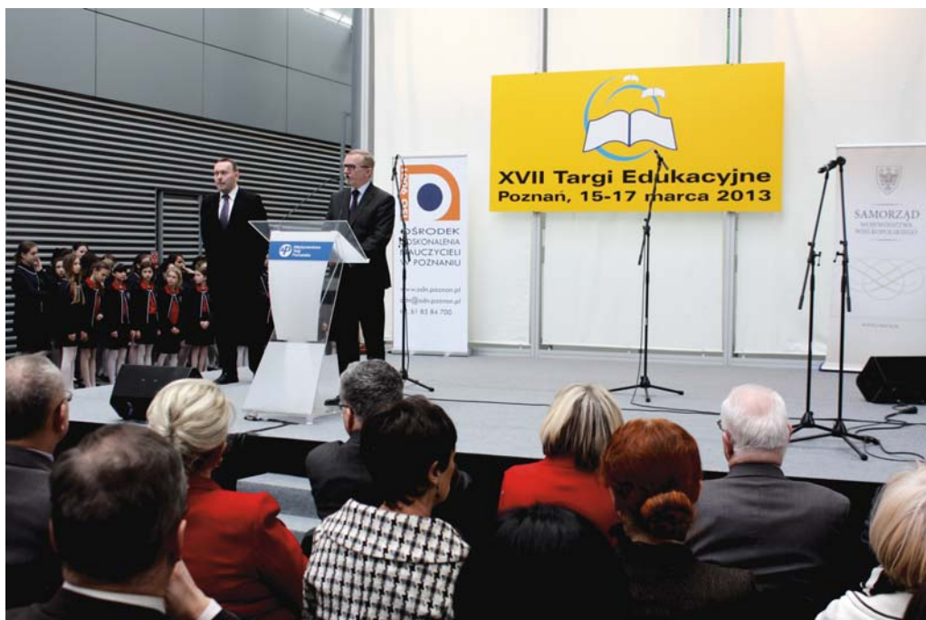
Uroczyste otwarcie XVII Targów Edukacyjnych.

Szkoły prowadzone przez Powiat Poznański, podobnie jak w roku ubiegłym, prezentowały się na wspólnym, nowoczesnie