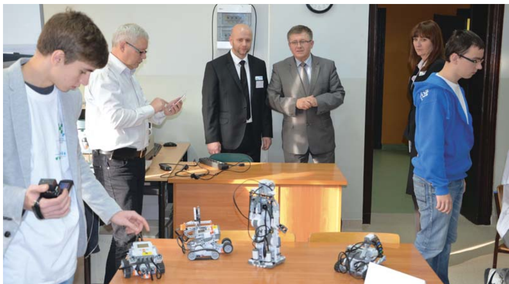
Uczniowie przygotowali wiele atrakcji, m.in. pokaz robotyki i prezentacje robotów.