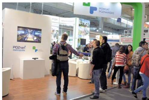
Interaktywne stoisko Powiatu Poznańskiego cieszyło się dużym zainteresowaniem.

Na naszym stoisku, wraz z Trampkiem i znanymi podróżnikami odwiedzić można