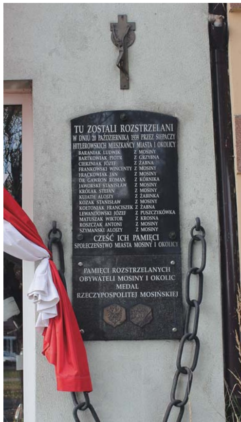
Tablica upamiętniająca pomordowanych 20 października 1939 r.