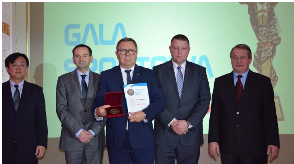
Jan Grabkowski, Starosta Poznański odbiera wyróżnienie Inwestor na Medal 2013.