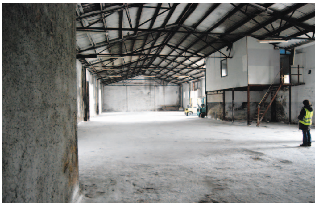
Magazyn po wywiezieniu odpadów 29 listopada.

Wydział Promocji i Aktywności Społecznej