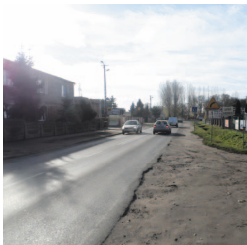
Ulica Poznańska w Skórzewie.