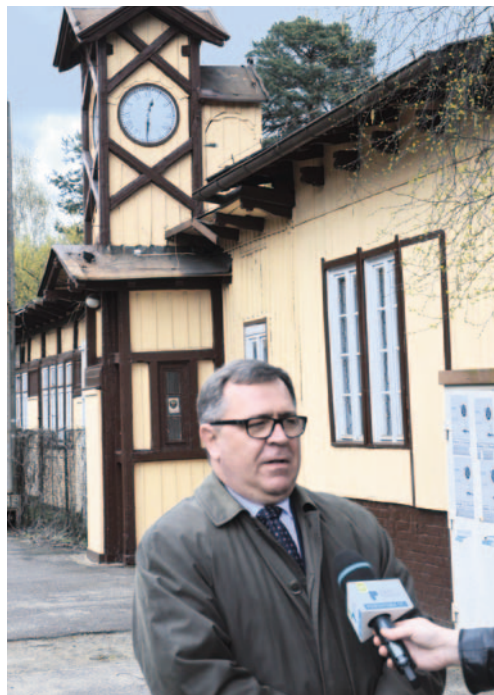
Jan Grabkowski, Starosta Poznański przed zabytkowym budynkiem byłego dworca kolejowego w Puszczykowie.