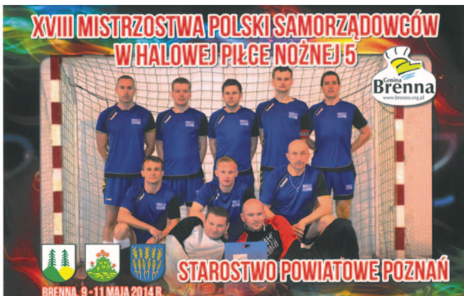
Drużyna Powiatu Poznańskiego.

Wydział Bezpieczeństwa i Zarządzania Kryzysowego