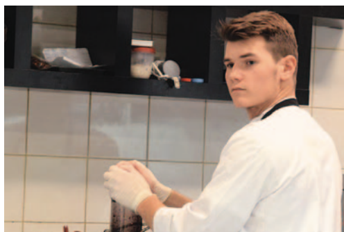
Fot. Hubert Gonera