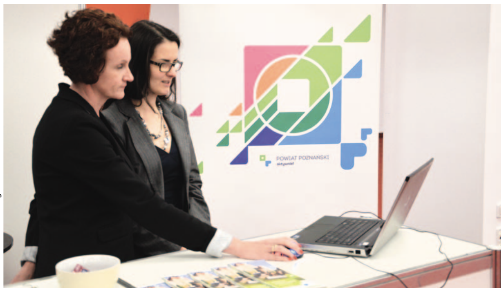
Fot. Hanna Kolanowska-Pogrzebna

Współpracy Zagranicznej i Promocji Przedsiębiorczości Gabinet Starosty