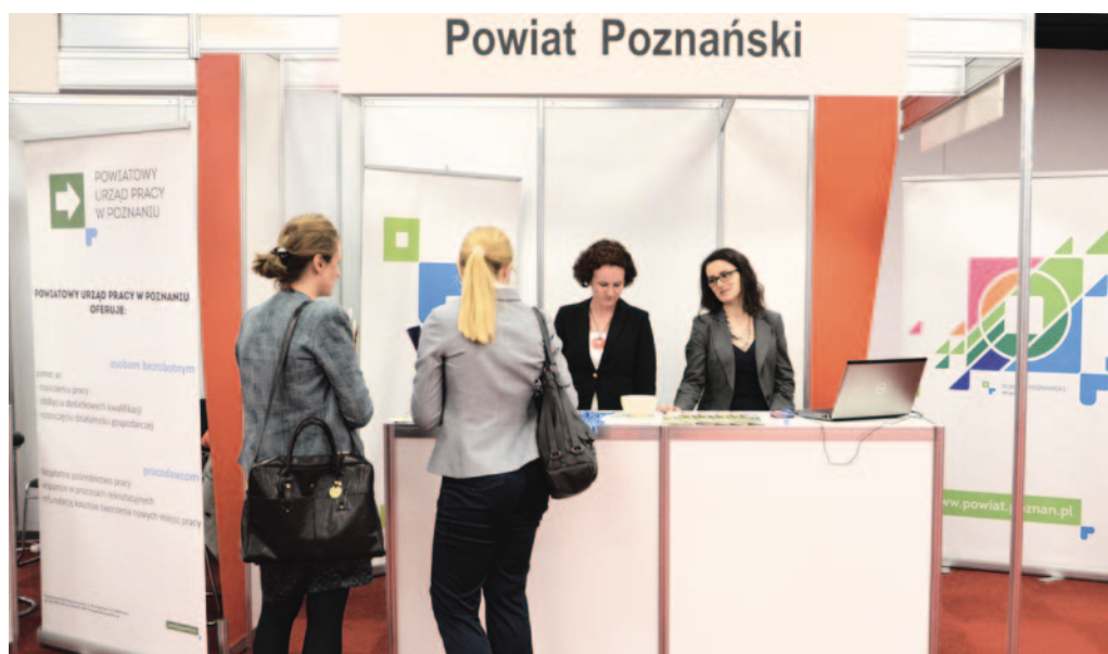
Na stoisku Powiatu Poznańskiego można było otrzymać informacje na temat rozwoju przedsiębiorczości w powiecie poznańskim.

świadczących usługi wspierające rozwój biznesu oraz instytucji otoczenia biznesu. Powiat Poznański również miał swoje stoisko, na którym wszyscy zainteresowani mogli uzyskać informację na temat rozwoju przedsiębiorczości w powiecie poznańskim oraz możliwości promocji własnej działalności gospodarczej za pośrednictwem Portalu Firm Powiatu Poznańskiego www.pfpp.com.pl – strony dedykowanej przedsiębiorcom. Części wystawieniczej Targów towarzyszyła część warsztatowa składająca się ze szkoleń, warsztatów i prelekcji o tematyce biznesowej.