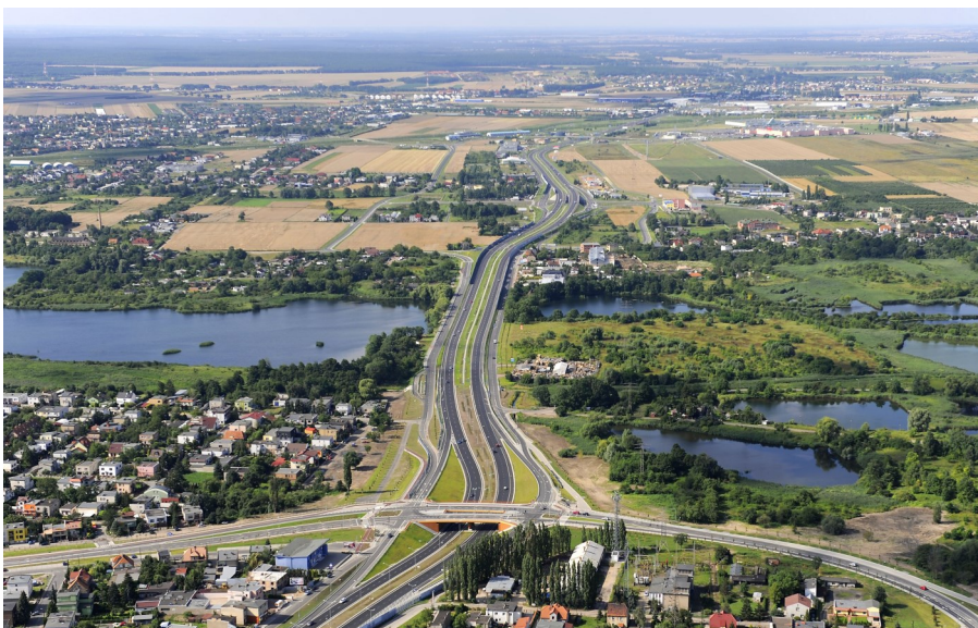
Badania mieszkalnictwa na terenie gmin tworzących Stowarzyszenie Metropolia Poznań odbywają się po raz pierwszy.

Do końca lutego 2016 r. powinien zakończyć się etap opracowywania badań. Efektem końcowym będą rekomendacje (diagnoza) opisująca potrzeby mieszkaniowe mieszkańców gmin tworzących Stowarzyszenie Metropolia Poznań z podziałem na poszczególne gminy. Badania finansowane są ze środków Stowarzyszenia Metropolia Poznań, ich koszt wynosi 125 tys. zł (netto). Badania prowadzi: Spółka Celowa Uniwersytetu Ekonomicznego w Poznaniu Sp. z o.o. oraz Centrum Badań i Edukacji Statystycznej GUS. ●