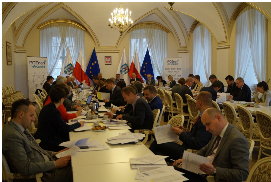
Spotkanie Rady Metropolii, w trakcie którego zatwierdzono Strategię ZIT odbyło się 6 listopada 2015 roku w Sali Białej UM w Poznaniu.