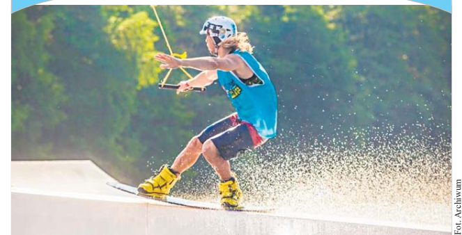
WakeCity w Stęszewie • ul. Bolesława Chrobrego 81a, Stęszew • www.wakecity.pl • tel. 530 88 44 88