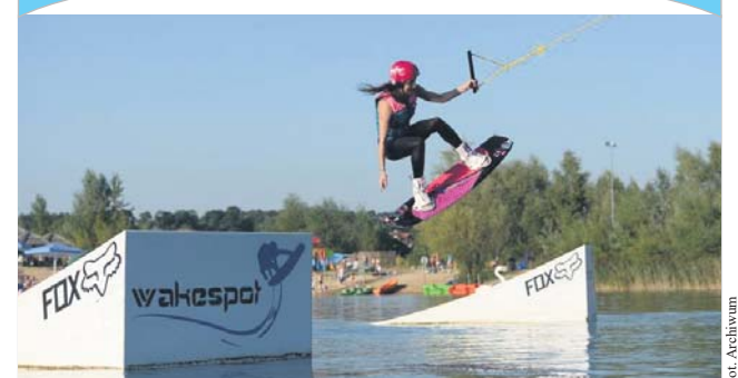
WakeSpot w Owińskach • ul. Plaźowa 1, Owińska • www.wakespot.pl • tel. 724 413 897

Rekomendowane Atrakcje Turystyczne Powiatu Poznańskiego warto odwiedzić przy okazji organizowanych przez nie wydarzeń. Oto lista najciekawszych imprez, które odbędą się jeszcze w tym roku: