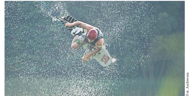
Kuwaka – Centrum Sportów Wodnych w Pobiedziskach • ul. Kiszowska 21, Pobiedziska • www.kuwakawake.pl • tel. 667 946 676