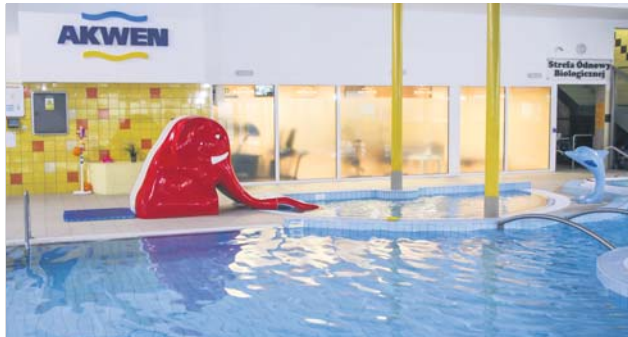
Pływalnia w Koziegłowach • ul. Piłsudskiego 3, Koziegłowy • www.akwencerwonak.pl • tel. 61 812 14 04