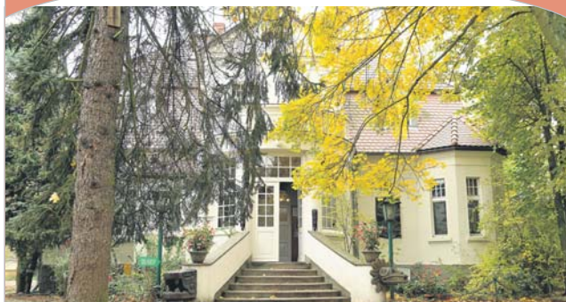
Fot. Marek Fiedler