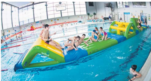
Kórnickie Centrum Rekreacji i Sportu Oaza • ul. Ignacego Krasickiego 1, Kórnik • www.oaza.kornik.pl • tel. 668 568 266