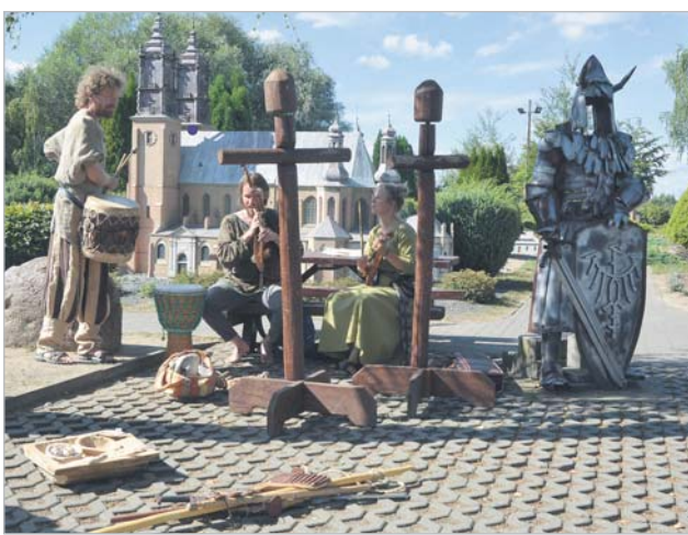
Na Festiwalu Legend Puszczy Zielonki można było między innymi posłuchać dawnej muzyki.