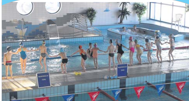
Pływalnia Wodny Raj w Swarzędzu • ul. Kosynierów 1, Swarzędz • www.scsir.swarzedz.pl • tel. 61 650 95 20