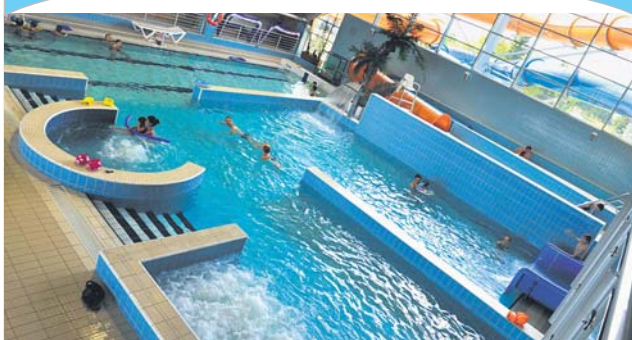
Park Wodny Octopus w Suchym Lesie • ul. Szkolna 18, Suchy Las • www.octopus.suchylas.pl • tel. 61 892 65 40