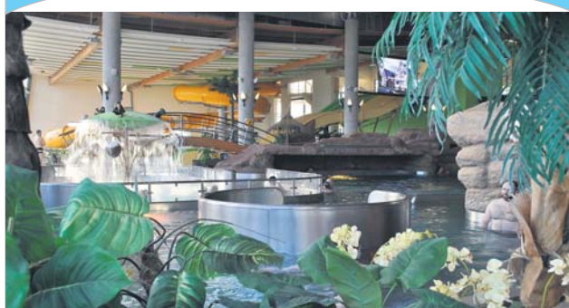
Tarnowskie Termy w Tarnowie Podgórnym • ul. Nowa 54, Tarnowo Podgórne • www.tarnowskie-termy.pl • tel. 61 625 90 64