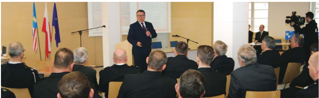
Jan Grabkowski, Starosta Poznański podsumował współpracę Powiatu Poznańskiego z OSP w 2013 roku.

Wydział Bezpieczeństwa, Zarządzania Kryzysowego i Spraw Obywatelskich