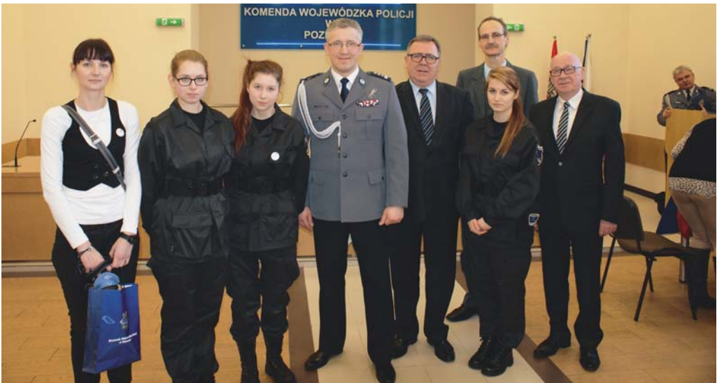
Przedstawiciele powiatu poznańskiego i wielkopolskiej policji wraz z przyszłymi policjantkami.