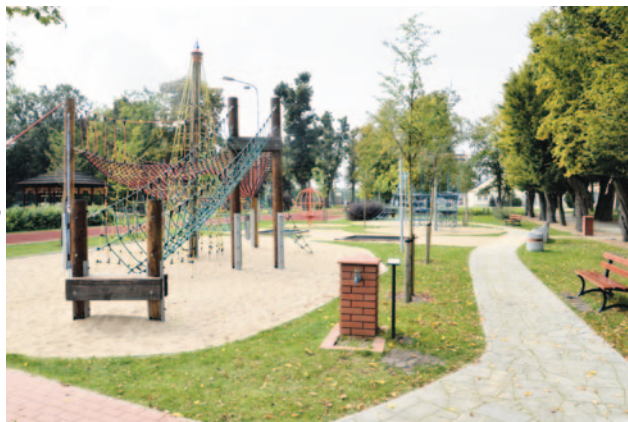
Park orientacji przestrzennej w Owińskach.

Większość obiektów sportowych powstało przy szkołach i placówkach opiekuńczo-wychowawczych. Część z nich również wymagała remontu. W tej kadencji prace remontowo-budowlane obję-