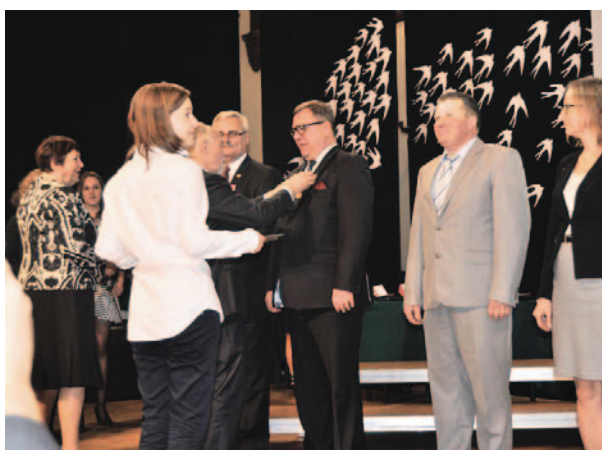
Starosta Poznański otrzymał medal Komisji Edukacji Narodowej z rąk Wojewody Wielkopolskiego.