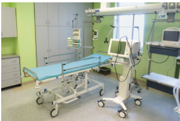
Oddział szpitalny w Puszczykowie.