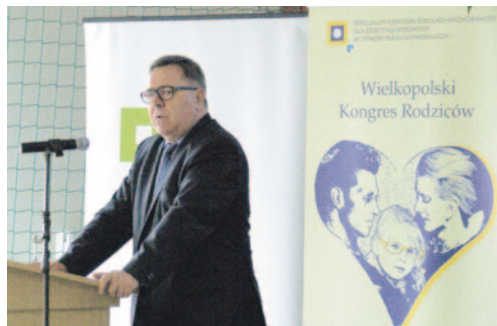
Jan Grabkowski, Starosta Poznański powitał zebranych gości.