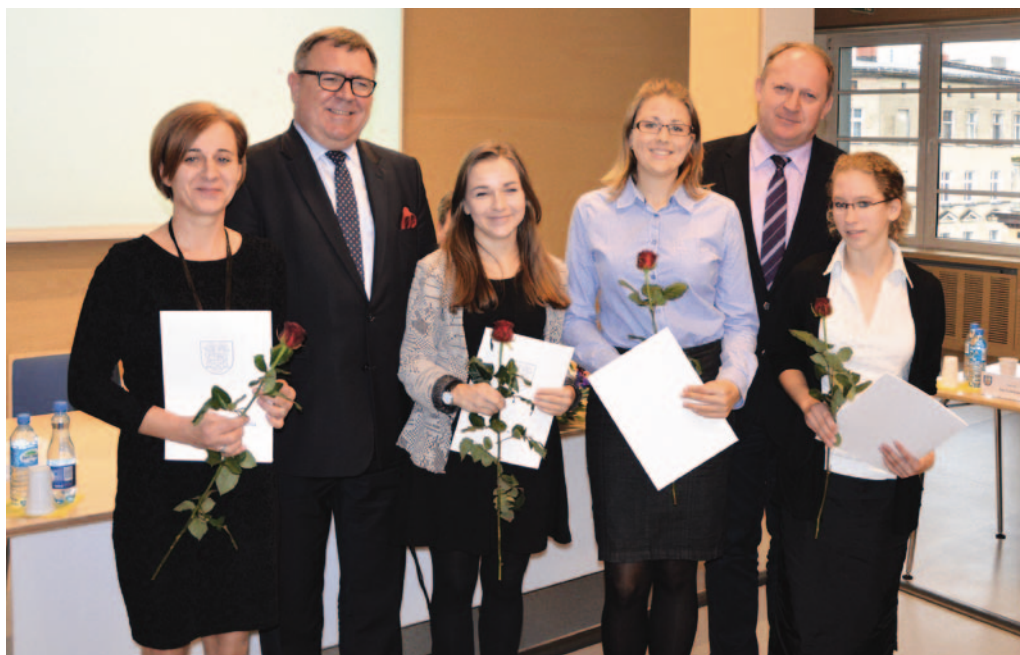
Starosta Poznański i Wiceprzewodniczący Rady Powiatu w Poznaniu wraz ze stypendystkami.

nią ocen minimum 5,0. W nagrodę, w roku szkolnym 2014/2015 przez 10 miesięcy, będą otrzymywać stypendium w wysokości 250 zł miesięcznie. Stypendia Rady Powiatu w Poznaniu wręczone zostały uczniom z: Zespołu Szkół w Kórniku, Zespołu Szkół nr 1 im. Powstańców Wielkopolskich w Swarzędzu, Zespołu Szkół nr 2 w Swarzędzu, Zespołu Szkół