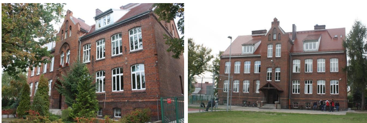
Stan obecny, przód i tył budynku, 2015 rok

wzniesiona na rzucie wydłużonego prostokąta, o dwutraktowym układzie wewnątrz, z sienią na osi i dwubiegową klatką schodową w trakcie tylnym. Budynek jest piętrowy podpiwniczony i nakryty wysokim dwuspadowym dachem (partia poddasza użytkowa) krytym ceramiczną dachówką. Elewacja wejściowa symetrycznie zakomponowana 9-osiowa z wejściem na osi. Partia środkowa zaakcentowana pseudoryzalitem zakończonym na wysokości poddasza trójkątnym szczytem ozdobionym trzema ostrołukowymi blendami. Dwa ostrołukowe okna piętra w zryzalitowanej partii fasady wpisane w zwieńczoną ostrym łukiem płytką niszę. Pozostałe okna artykułujące elewację zamknięte odcinkowo. W roku 2012 wykonana została modernizacja dachu, wymieniona stolarka okienna i przeprowadzono renowację stolarki drzwiowej, podwyższono również lukarny na poddaszu. Przeprowadzono modernizację klatki schodowej i pomieszczeń piwnicznych. Wykonano drenaż opaskowy wokół budynku. Na początku 2016 roku zakończyło się postępowanie przetargowe w celu wykonania dokumentacji projektowej rozbudowy Zespołu Szkół w Bolechowie, Szkoły w Murowanej Goślinie.