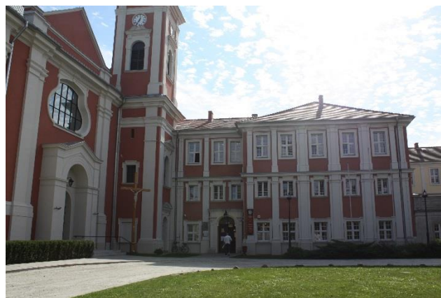
Rycina z 1910 r. i stan obecny 2015 rok

Historia opactwa cysterek w oddalonych od Poznania o kilkanaście kilometrów Owińskach sięga połowy XIII wieku Według Długosza, książę Wielkopolski Przemysł I ufundował w swojej wsi w Owińskach nad Wartą klasztor wraz z kościołem dla przybyłych z Trzebnicy siostr cysterek. Konwent mniszek przewodziła ksieni (przełożona klasztoru) Gertruda - córka św. Jadwigi i Henryka I Brodatego. Jako uposażenie konwent otrzymał w 1252 r. wielkie dobra, które przez stulecia były podstawą utrzymania klasztoru. W momencie wystawienia dokumentu fundacyjnego prawdopodobnie istniały już murowane z cegły kościół z klasztorem. Najdawniejsze dzieje klasztoru ze względu na skąpe źródła są słabo znane. Od XI-XIII konwent liczył od 15 do 30 zakonnic. Przy klasztorze istniała szkoła dla dziewcząt z rodzin szlacheckich i bogatych domów mieszczańskich. Zakonnice przez ponad 500 lat prowadziły działalność gospodarczą na swoich ziemiach rozwijając rolnictwo, zakładając sady, ogrody i warzywniki, budując młyny, groble, stawy oraz jazy, a od XVI wieku folwarki.