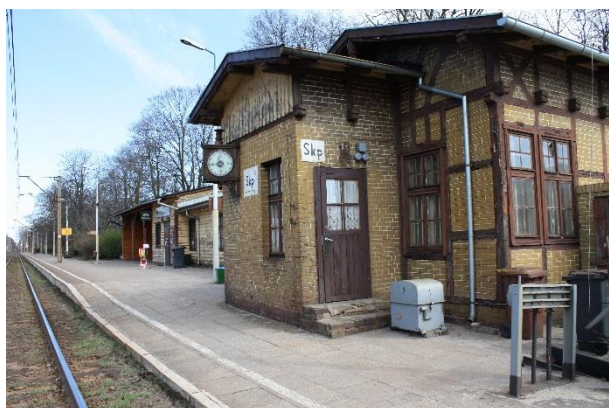
Stan przed remontem