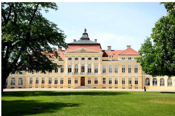
Pałac Raczyńskich w Rogalinie, 2015 rok