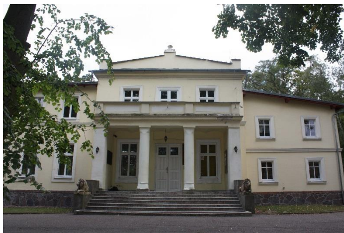
Stan obecny, 2015 rok, fot. Archiwum

Dwór powstał na pocz. XX w., w latach późniejszych był wielokrotnie modernizowany, m. in. w latach 40. XX w. nadbudowano pierwotnie parterowe jego partie boczne. Dwór jest budynkiem ceglanym, o tynkowanych ścianach. Wzniesiono go na rzucie prostokąta, partie środkowe od frontu i od podwórza lekko zryzalitowane. Zwartą, piętrową bryłę nakrywają niskie dachy kryte papą. Elewacje dworu podzielono gzymsem profilowanym. Elewacja frontowa jest 7-osiowa, z 3-osiowym ryzalitem zwieńczonym trójkątnym szczytem. Ryzalit poprzedza taras oraz wsparty na parze kolumn balkon. Przy schodach prowadzących do głównego wejścia umieszczono rzeźby leżących lwów. Rezydencję otacza krajobrazowy park założony na pocz. XIX w. W 2007 Starostwo Powiatowe w Poznaniu za prace remontowe w Zespole Szkół w Rokietnicy wyróżnione zostało w konkursie „Modernizacja roku”. W celu przystosowania obiektu do obowiązujących przepisów oraz wykonania niezbędnych prac, dla wprowadzenia funkcji dydaktycznej na piętrze budynku, wykonana została inwentaryzacja budynku, opinia techniczna oraz badania konserwatorskie. Zlecone zostało wykonanie dokumentacji projektowej pn.: „Przebudowa budynku administracyjnego Zespołu Szkół w Rokietnicy przy ul. Szamotulskiej 24”. Na rok 2016 planowano jest realizację ww. zadania.