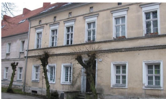
Stan przed remontem