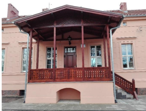
Stan po remoncie, przód i tył budynku, 2015 rok, fot. Archiwum