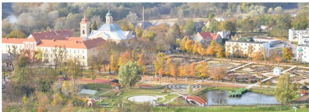
Stan obecny, 2012 rok

5.2. Szkoła w Murowanej Goślinie , gm. Murowana Goślina - technikum i zasadnicza szkoła zawodowa należąca do Zespołu Szkół im. Gen. Dezyderygo Chłapowskiego w Bolechowie. Neogotycką szkołę podstawową przy ul. Szkolnej 1 zbudowano w 1897 r. Budynek ujęto w ewidencji konserwatorskiej województwa wielkopolskiego. Jest to budowla o elewacjach z czerwonej cegły,