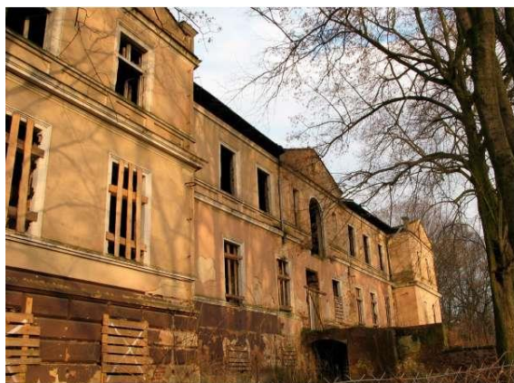
Pałac w Nieszawie, 2012 rok

nich straciło swój dawny wystrój, zmieniono ich układy wnętrz. Do najgorzej zachowanych obiektów należy pałac w Nieszawie, zameczek na wyspie jeziora Góreckiego, dwory w Bolechowie i Łopuchowie. Najważniejsze zadania to opracowanie dla tych obiektów studiów historyczno-architektonicznych oraz przeprowadzenie badań architektonicznych, w dalszej kolejności - wykonanie dokumentacji budowlanej i konserwatorskiej oraz przeprowadzenie prac remontowych i modernizacyjnych z zachowaniem lub przywróceniem pierwotnego układu wnętrz. Często konieczne jest znalezienie właściwego sposobu użytkowania obiektu (np. przeznaczenie na cele hotelowe, szkoleniowo - konferencyjne i in.). Także inne zabudowania zespołów (oficyny itp.) wymagają przeprowadzenia prac remontowych. Należy odnotować przeprowadzenie szeroko zakrojonych remontów pałaców w Rogalinie (gm. Mosina), Szreniawie (gm. Komorniki) i w Gułtowach (gm. Kostrzyn), należących do grupy najbardziej charakterystycznych i reprezentacyjnych obiektów powiatu poznańskiego.