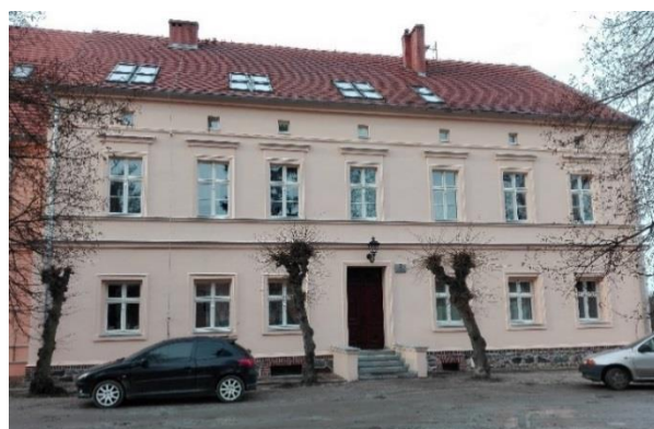
Stan po remoncie, 2015 rok