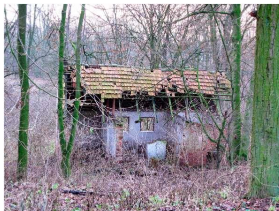
Park w Nieszawie, 2012 rok, fot. Archiwum

Stan zabytkowych parków jest bardzo zróżnicowany. Niektóre zachowane są w stanie dobrym, dość duża grupa - w stanie dostatecznym. Najwięcej jest jednak parków w stanie złym. Ponieważ często stanowią one jedyny zadrzewiony teren w miejscowości - dlatego należy zachować istniejący drzewostan oraz dążyć do przywrócenia parkom ich dawnej świetności. Większość parków wymaga sporządzenia aktualnych inwentaryzacji drzew oraz projektów rewaloryzacji, obejmujących odtworzenie dawnego drzewostanu, nasadzenia uzupełniające oraz usuwanie z ich terenu obiektów dyszarmicznych. Po wykonaniu w/w prac należy systematycznie przeprowadzać zabiegi pielęgnacyjne w celu niedopuszczenia do ponownej degradacji.