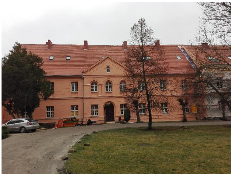
Stan po remoncie, 2015 rok

Budynek ceglany, otynkowany, wzniesiony na rzucie wydłużonego na osi pń.- pfd. prostokąta z fasadą zwróconą w kierunku dawnego kościoła klasztornego. Parterową bryłę (podpiwniczoną) dawnego probostwa nakrywa dwuspadowy dach. Elewacja wejściowa - wsch. 9-osiowa z 3 - osiowym płytki ryzalitem pośrodku. Układ wnętrza dwu i półtraktowy z obszerną sienią na osi i klatką schodową w ryzalicie zach. Sień i część pomieszczeń parteru sklepiona kolebkowo. Obecnie we wnętrzu na parterze znajdują się pomieszczenia administracyjne i gabinety lekarskie na piętrze i poddaszu internat. Dawne probostwo łączy z klasztorem pasaż zbudowany w latach 1835 - 1938.