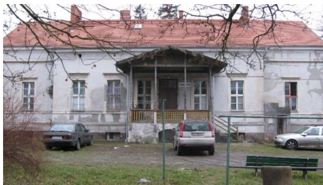
Stan przed remontem, przód i tył budynku, 2015 rok, fot. Archiwum