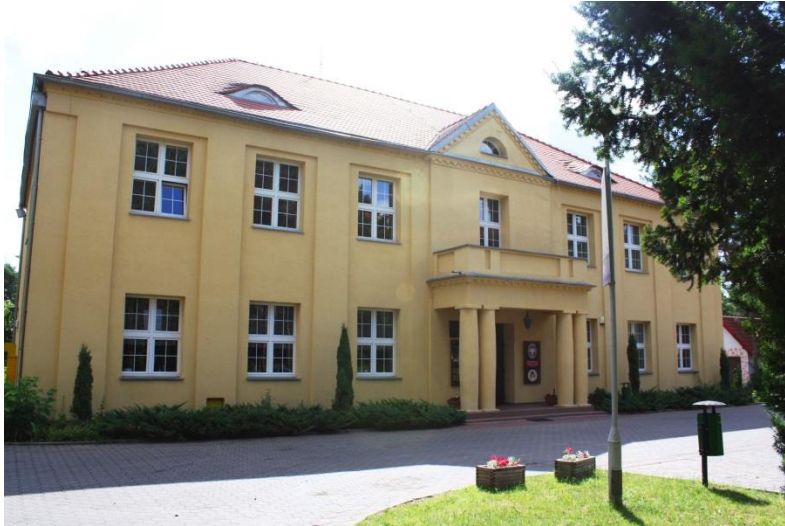
„Dom Młodej Polki”, 2010 rok

5.5. Budynek d. szkoły katolickiej, ob. Zespół Szkół w Kórniku, gm. Kórnik - usytuowany jest przy ul. Poznańskiej. Powstał po 1914 r. Obecnie, od 1953 r. mieści się tu powstałe w 1945 r. z inicjatywy pracowników Biblioteki Kórnickiej, Liceum Ogólnokształcące, obecnie Zespół Szkół im. Generałowej Jadwigi Zamoyskiej.