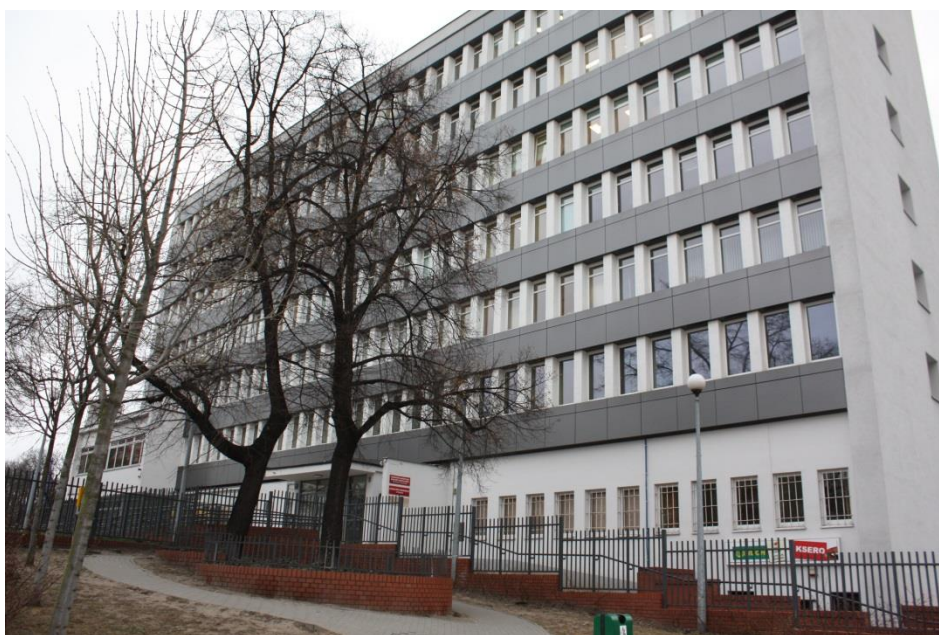
Budynek przy ulicy Zielonej 8, 2010 rok

Budynki te nie podlegają ochronie konserwatorskiej, ale planując jakiegokolwiek prace budowlane należy uwzględnić wytyczne, obowiązujące w strefie ochrony konserwatorskiej.