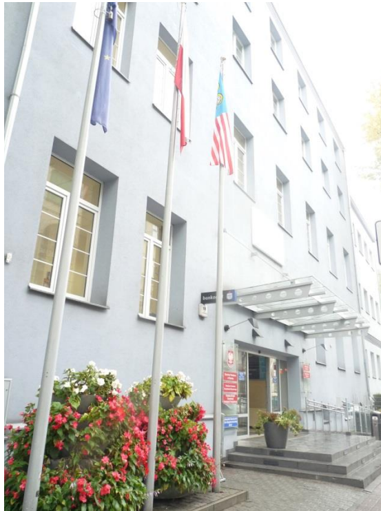
Budynek Starostwa Powiatowego przy ulicy Jackowskiego 18, 2015 rok

Po II wojnie światowej i likwidacji zakładów wojskowych w budynku ulokowano w latach 70 XX w. Zakłady Odzieżowe „Modena”. Od lat 90 XX w. Od reformy administracyjnej w 1999 r. budynek przy ul. Jackowskiego 18 znajduje się w posiadaniu Starostwa Powiatowego. W roku 2005 wykonana została termomodernizacja budynku, w kolejnych latach modernizacja pomieszczeń biurowych, sanitariatów, korytarzy i ciągów komunikacyjnych.