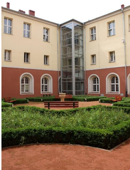
Wirydarz z widoczną windą, 2013 rok

przeznaczono na prace badawcze, w tym: na prace archeologiczne - 61.000 zł, konserwatorsko-architektoniczne - 24.900 zł.