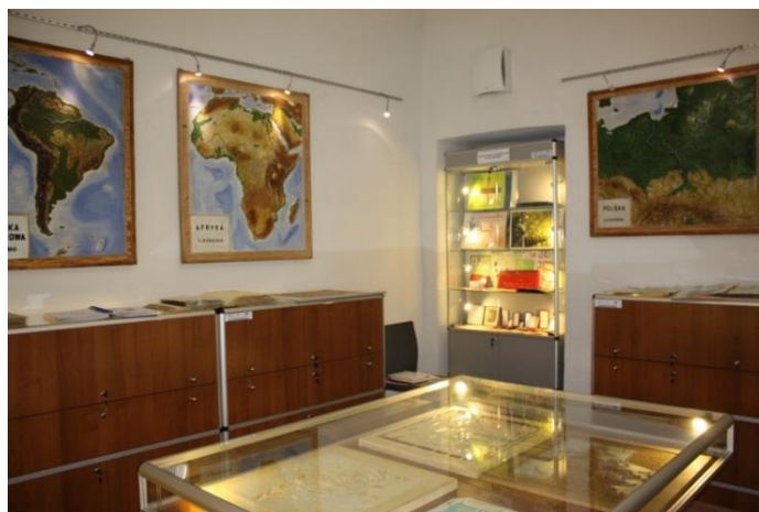
„Muzeum Tyflogiczne” w Owińskach, 2013 rok