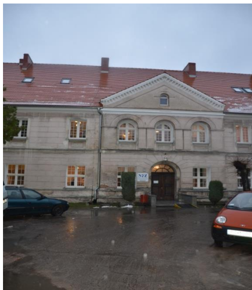
Stan przed remontem