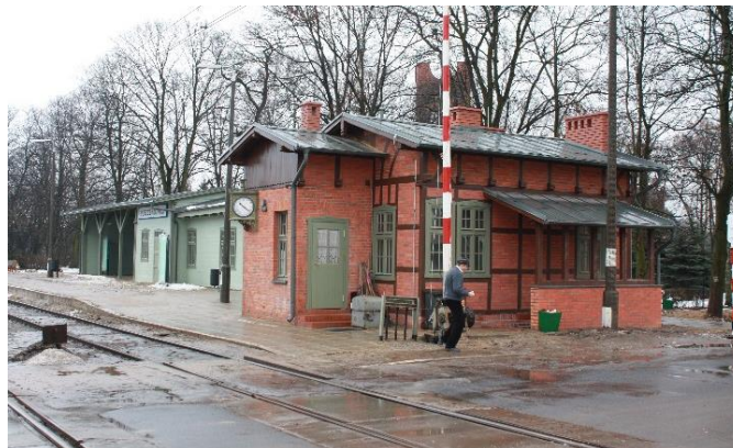
Stan po remoncie, 2011 rok