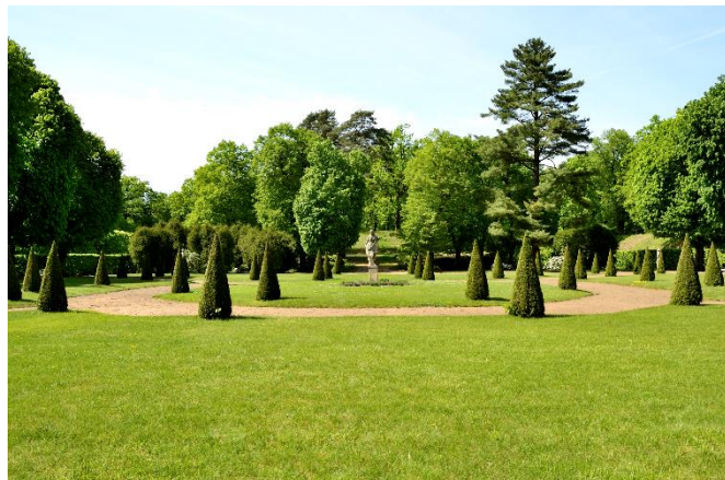
Park w Rogalinie, 2015 rok