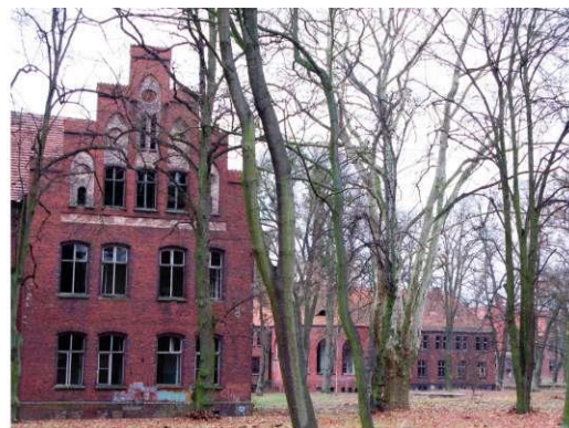
Jeden z pawilonów Zakładu Psychiatrycznego w Owińskach. Stan przed 1939 r. i 2012 r.

W takich wypadkach konieczne jest opracowanie stosownej dokumentacji historyczno-architektonicznej i budowlano-remontowej, następnie przeprowadzenie prac restauratorskich. W skrajnych przypadkach należy podjąć kroki prawne w celu przymuszenia właścicieli lub użytkowników do przeprowadzenia remontów.