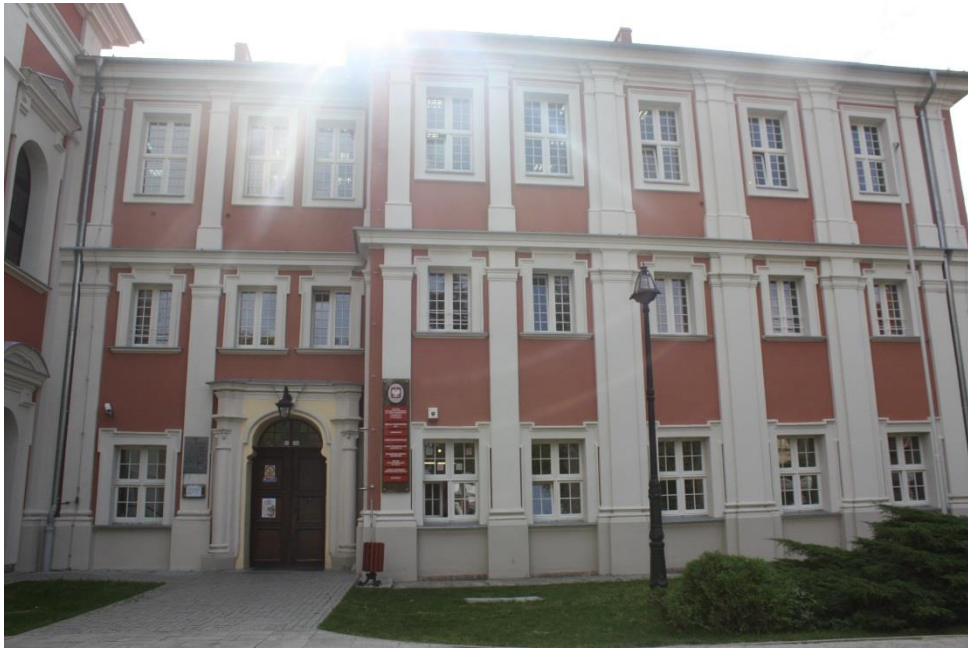
Stan obecny, 2015 rok

Budynek klasztorny składa się z czterech skrzydeł zamykających kwadratowy wirydarz. Do płn. skrzydła przylega kościół p.w. św. Jana Chrzciciela, a do skrzydła zachodniego dostawiono prostopadle długie skrzydło zwrócone zach. szczytem ku Warcie. Wszystkie skrzydła są 3-kondygangcyjne i nakryte dachem o mocno wysuniętym okapie (drugie piętro nadbudowane zostało po 1874 r. - jedynie część skrzydła płn. przylegająca do kościoła nie została nadbudowana). Płd. partia zach. skrzydła klasztornego ma podwyższone obydwie piętra i występuje z bryły budynku w środku mieści się sala gimnastyczna i aula, d. kaplica). Wnętrza są półtoratraktowe z szerokim krużgankiem obiegającym cały wirydarz i przykryte sklepieniem krzyżowym i krzyżowo żebrowym. Kilka pomieszczeń zachowało barokowe sklepienia z dekoracją stiukową np. dawny refektarz obecnie sala jadalna w płd. krańcu skrzydła zach.