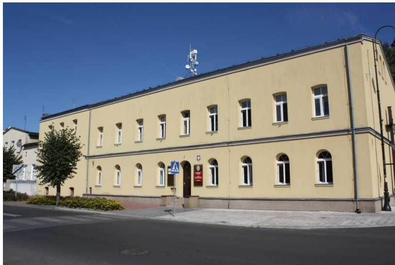
Dawna szkoła katolicka, ob. Zespół Szkół. Stan obecnie, 2015 rok

5.5. Budynek d. szkoły katolickiej, ob. Zespół Szkół w Kórniku, gm. Kórnik - usytuowany jest przy ul. Poznańskiej. Powstał po 1914 r. Obecnie, od 1953 r. mieści się tu powstałe w 1945 r. z inicjatywy pracowników Biblioteki Kórnickiej, Liceum Ogólnokształcące, obecnie Zespół Szkół im. Generałowej Jadwigi Zamoyskiej.