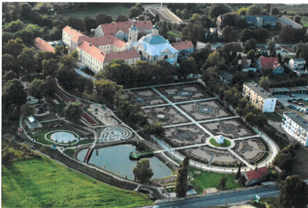
Park Orientacji Przestrzennej po rewaloryzacji

Całkowity koszt realizacji przedsięwzięcia wyniósł 5.782.765,58 zł.