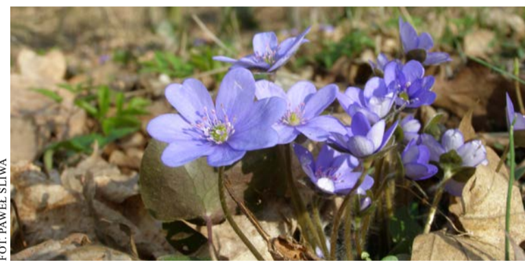
Wiosenne dywany kwiatowe w Parku Krajobrazowym Promno

Jednym z pierwszych sygnałów nadchodzącej zmiany pór roku są efektowne żółte łany ranników zimowych, które można podziwiać na Kokoryczowym Wzgórzu w poznańskim Radojewie. Później przychodzi czas na najsłynniejszy florystyczny spektakl w sąsiedztwie Poznania – czyli masowe kwitnienie przepięknych śnieży wiosennych. Aby go zobaczyć, co roku tysiące osób odwiedza Rezerwat Śnieżycowy Jar koło Starczanowa. Śnieżyce rosną tam na terenie... poligonu wojskowego, więc przed wycieczką trzeba się upewnić, czy w danym dniu obszar rezerwatu jest dostępny dla zwiedzających. Kto już widział białe kobierce w lesie, może dla odmiany poszukać ich na terenie arboretum w Kórniku. Świetnym miejscem na tropienie śladów wiosny może być również drugie, mniej znane arboretum w Zielonce albo Park Orientacji Przestrzennej w Owińskach. Warto też zaplanować sobie wycieczkę do Wielkopolskiego Parku Narodowego albo Parku Krajobrazowego Promno, gdzie przed pojawieniem się liści na drzewach dno lasu w wielu miej-