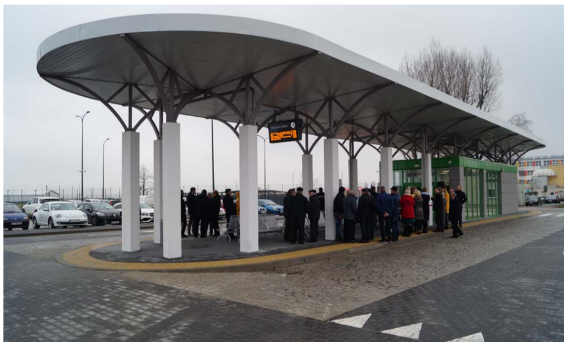
Inwestycja przyciąga uwagę nie tylko swoim nowoczesnym wyglądem, ale także udogodnieniami dla pasażerów

Projekt pn. Budowa zintegrowanego węzła przesiadkowego wraz z infrastrukturą towarzyszącą oraz inwestycje w zakresie publicznego transportu zbiorowego na terenie gminy Kleszczewo obejmuje budowę dwóch węzłów – w Kleszczewie i w Tulcach. Otwarty węzeł w Kleszczewie robi bardzo pozytywne wrażenie. Inwestycja przyciąga uwagę nie tylko swoim nowoczesnym wyglądem, ale także udogodnieniami dla pasażerów. Na węźle znajduje się ogrzewana poczekalnia, jak również toaleta. Bieżące informacje o godzinach odjazdów autobusów wyświetlane są na aktywnej tablicy umieszczonej na peronie. Kierowcy mogą zostawić swoje auta na parkingu przygotowanym dla 56 pojazdów. Jest oczywiście też miejsce dla rowerów, wiata pomieści 30 jednośladów. Inwestycja została zrealizowana z udziałem środków unijnych – z Wielkopolskiego Regionalnego Programu Operacyjnego, programu Zintegrowanych Inwestycji Terytorialnych w Miejskim Obszarze Funkcjonalnym Miasta Poznania. Projekt, oprócz budowy dwóch węzłów przesiadkowych przewiduje m.in. budowę dróg rowerowych o długości 0,838 km, pięciu obiektów P&R z 240 miejscami postojowymi, trzech obiektów B&R z 78 miejsca-