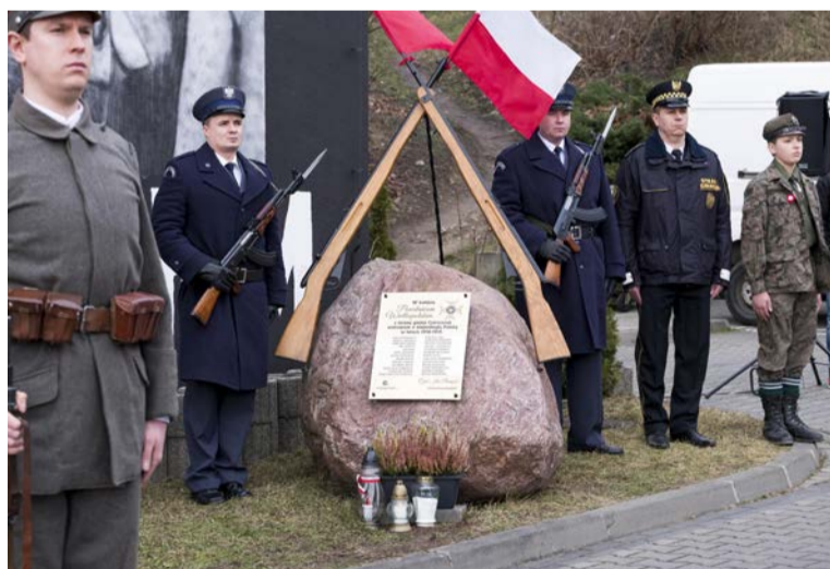
Wartę honorową pełnili służby mundurowe

Po okolicznościowych przemówieniach, odśpiewaniu hymnu państwowego, od-