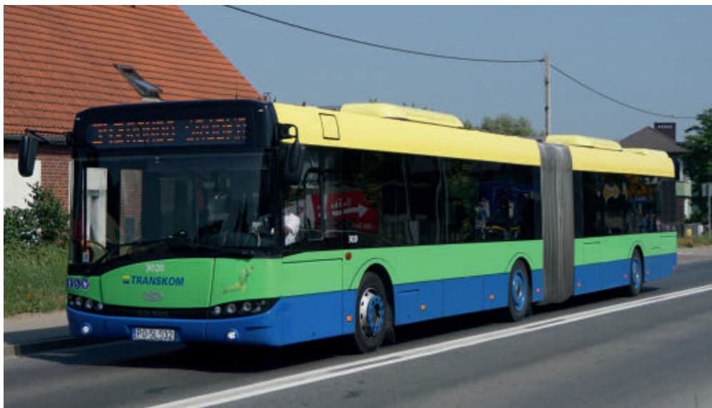
Solaris Urbino III 18, Transkom Koziegłowy

nik oraz brak spięcia systemu dróg ekspresowych S5 i S11 od północy, tzw. obwodnicą północno-wschodnią, która połączyłaby węzeł drogowy w Złotkowie na S11 z węzłem drogowym Kleszczewo na S5. To właśnie o budowę tej drogi mocno zabiega powiat poznański z uwagi na możliwość znacznego odciążenia ruchu na obszarze gmin Czerwonak, Swarzędz i Suchy Las oraz samego Poznania w rejonie ulicy Lechickiej i Obornickiej.