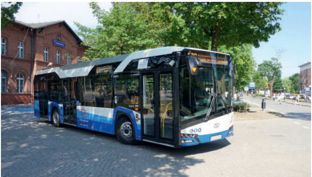
Solaris Urbino Hybrid przed stacją kolejową w Pobiedziskach