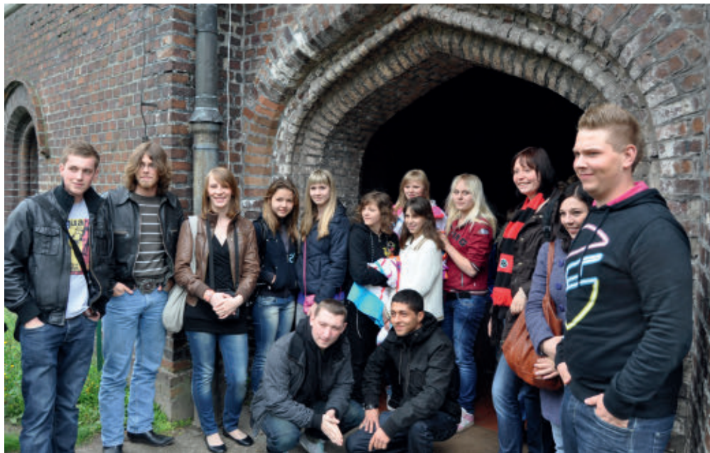
Wymiana młodzieży w 2010 roku, zamek w Kórniku

w liczne atrakcje. Były zajęcia sportowo-rekreacyjne, warsztaty i wycieczki mające na celu poznanie kultury i historii. Wszystko to sprzyjało nawiązywaniu nowych przyjaźni. Od 2012 roku wymiana przybrała inną formę. Uczniowie ze szkoły Justus von Liebig Schule w Hanowerze w ramach działania „Praca dla pokoju – pojednanie nad grobami” przyjeżdżają wiosną do Polski i porządkują kwatery wojenne cmentarza miłostowskiego w Poznaniu. Współpracują przy tym z koleżankami i kolegami z Zespołu Szkół nr 1 w Swarzędzu. Celami projektu są uczczenie pamięci wszystkich ofiar drugiej wojny światowej, rozmowy na ważne dla obu narodów tematy historyczne oraz poznanie wspólnej kultury i tradycji. Młodzież z hanowerskiej szkoły przyrodniczo-rolniczej odwiedziła powiat poznański już sześciokrotnie.