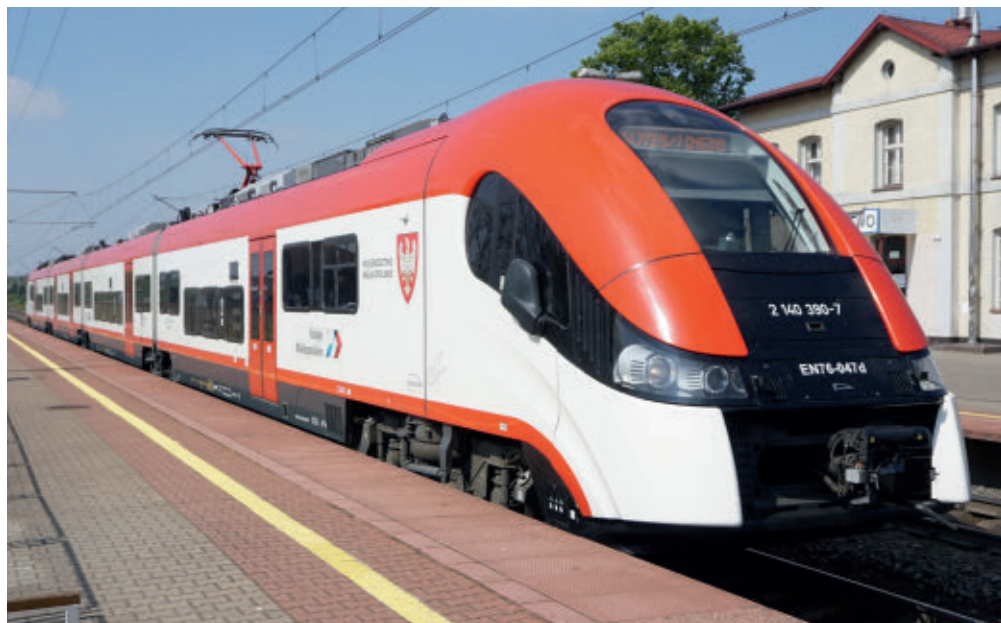
Elf Kolei Wielkopolskich

z Poznania do Murowanej Gośliny, Kleszczewa, Kórnik i Zaniemyśla, Mosiny, Dopiewa i Swarzędza. Te same gminy oraz gminy Puszczykowo, Kostrzyn i Pobiedziska organizują transport gminny za pośrednictwem własnych spółek komunalnych lub przewoźników prywatnych. Dodatkowo gminy, dzięki finansowemu wsparciu powiatu poznańskiego, uruchamiają kolejne linie międzygminne łączące m.in. Swarzędz z Pobiedziskami, Swarzędz z Kleszczewem i Mosinę z Kórnikiem. Łącznie system transportu publicznego na terenie powiatu obejmuje 225 linii autobusowych, z których \frac{1}{4} to linie dojazdowe do Poznania, w większości przypadków funkcjonujących w godzinach 4.00–21.30, zapewniając co najmniej 24 kursy na dobę. Linie na głównych kierunkach dojazdowych, takich jak Swarzędz, Koziegłowy i Komorniki, posiadają częstotliwość porównywalną z liniami miejskimi układu podstawowego, czyli ponad 100 kursów na dobę. Linie typowo gminne funkcjonują głównie w godz. 6.00–20.00, zapewniając około 10 kursów na dobę. Czas kursowania determinowany jest przede wszystkim pracą szkół. Niestety niewiele linii pozostaje ściśle skorelowanych z koleją. Wskaźnik dopasowania kursów docierających do