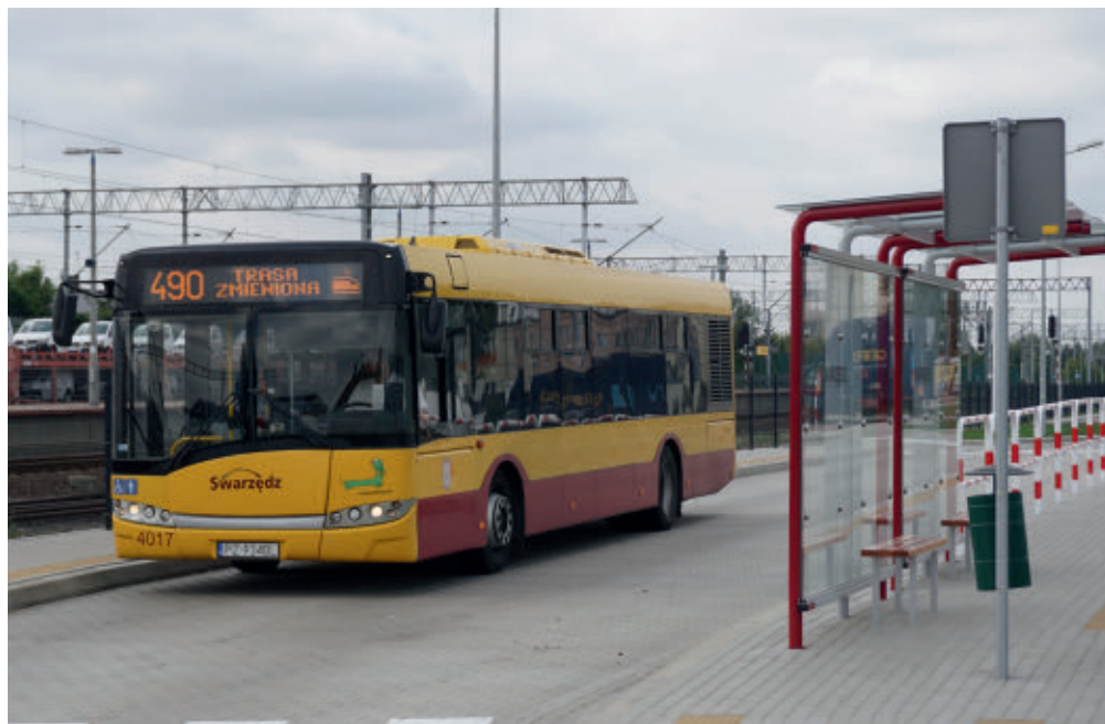
Węzeł przesiadkowy w Swarzędzu

Od 1 października 2019 roku powiat poznański przy współpracy z miastem Poznań, 7 powiatami i 17 gminami stał się organizatorem 56 linii regionalnych obsługiwanych przez PKS Poznań S.A. Celem tego działania były m.in.: