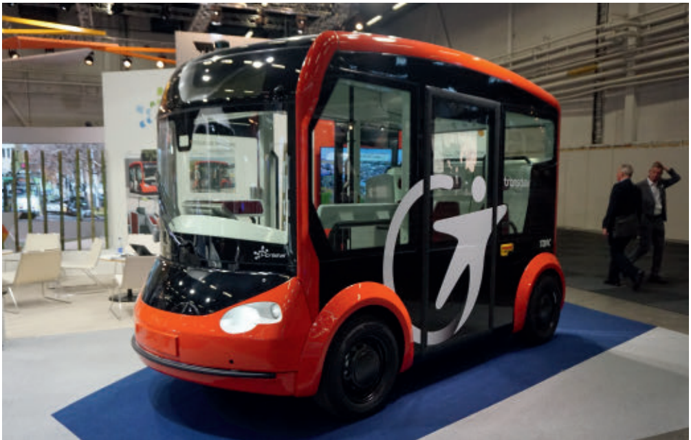
Autobus autonomiczny

Wzdłuż linii głównych należałoby wyznaczyć punkty przesiadkowe podobne do tych, jakie wybudowały gminy m.in. w Swarzędzu na os. Kościuszkowców lub w Kleszczewie i Tulcach. To właśnie z tych punktów startować będą małe autobusy, których zadaniem będzie obsługa podróży w ramach „ostatniej mili”, dowożące pasażerów do miejscowości odległych do 10 km od punktów przesiadkowych. W przyszłości będą to autobusy autonomiczne (bez kierowcy) z napędem elektrycznym, a więc