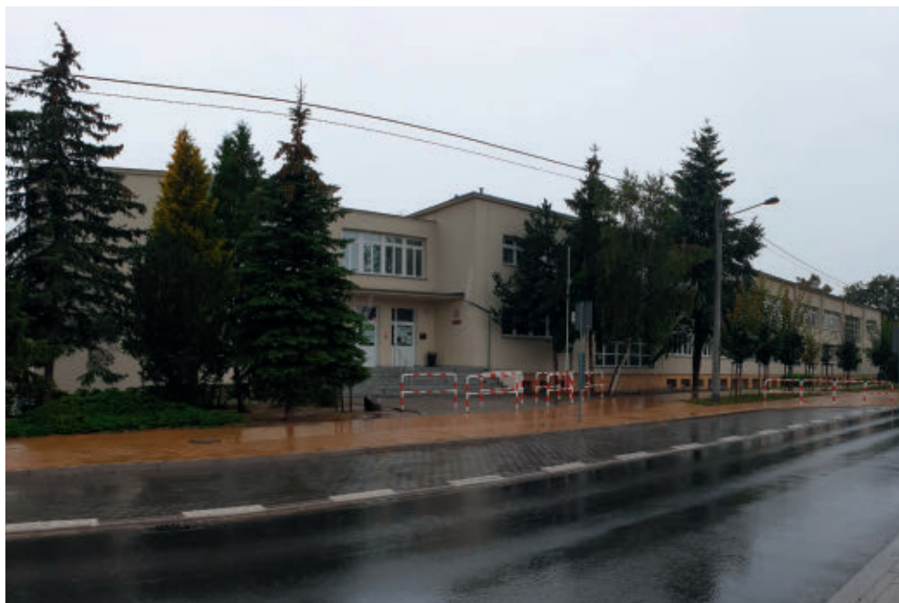
Szkoła Podstawowa im. Jana Pawła II w Tarnowie Podgórny fol. Mariusz Lewoczko

zakończeniu drugiej wojny światowej, w 1945 roku, przy czym placówka stacjonowała w czterech budynkach: przy ulicy Szkolnej, przy ulicy Poznańskiej, w tzw. Pastorówce oraz w tzw. salce św. Józefa przy ulicy Rokietnickiej. Przełomem dla tarnowskiej szkoły był rok 1962, kiedy oddano do użytku nowy budynek szkolny, tzw. tysiąclatkę przy ulicy Szkolnej. Jedenaście lat później, w 1973 roku, szkoła przekształciła się w Gminną Szkołę Zbiorczą w Tarnowie Podgórny, do której uczęszczali nie tylko uczniowie z samego Tarnowa Podgórny, ale także z Góry, Kokoszczyzna, Rumianku, Lusówka, Sadów i Swadzimia. Szkoła ta funkcjonuje do dziś w budynku przy ulicy Szkolnej 5 jako Szkoła Podstawowa nr 1 im. Jana Pawła II w Tarnowie Podgórny. W związku z dynamicznym rozwojem gminy Tarnowo Podgórny w latach 2009–2010 budynek szkolny został powiększony o nowe sale dydaktyczne oraz salę gimnastyczną. Długą historię tej placówki oświatowej podkreśla fakt, że 13 października 2012 roku Szkoła Podstawowa im. Jana Pawła II w Tarnowie Podgórny hucznie świętowała pięćdziesięciolecie istnienia. Od 1 września 2018 roku