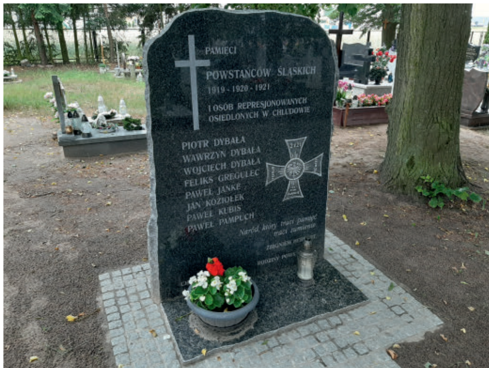
Tablica na cmentarzu w Chludowie

Pamięć o powstańcach śląskich nadal jest żywa i kultywowana wśród członków ich rodzin mieszkających na terenie gminy Suchy Las. 10 listopada 2019 roku na cmentarzu parafialnym w Chludowie odsłonięto pamiątkową tablicę poświęconą powstańcom śląskim, którzy pod wpły-