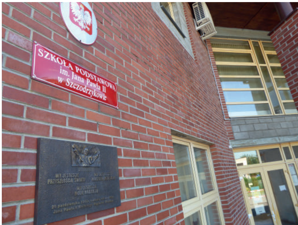
Szkoła Podstawowa im. Jana Pawła II w Szczodrzykowie