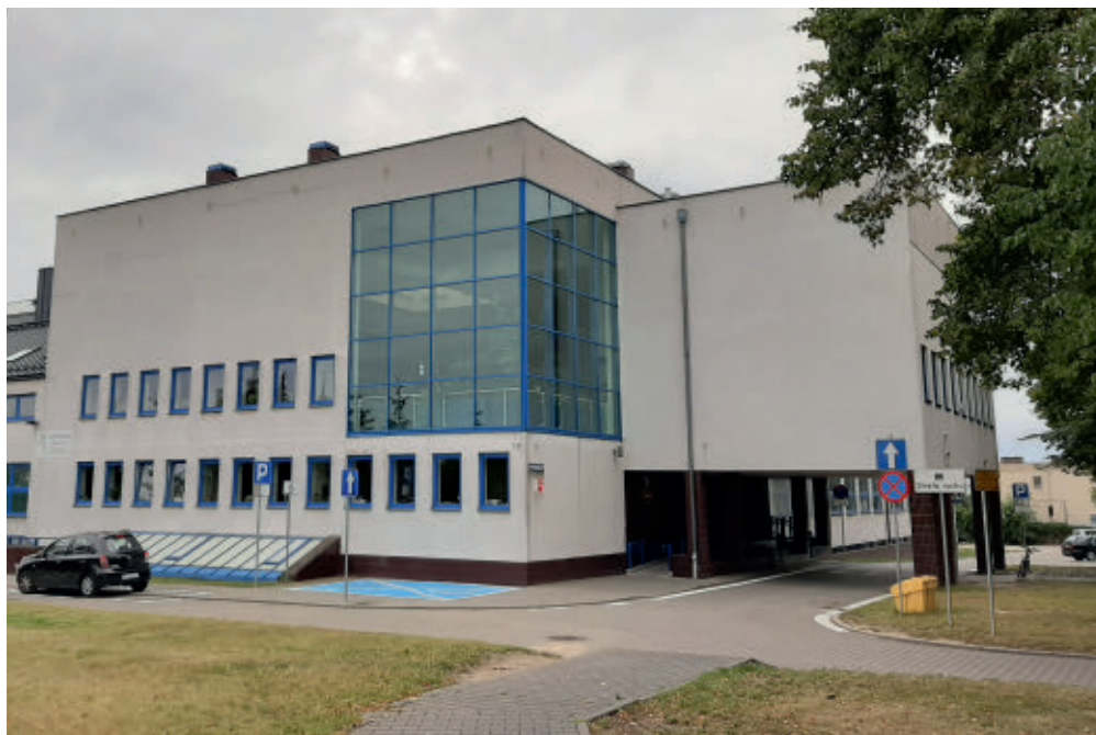
Szkoła Podstawowa im. Jana Pawła II w Suchym Lesie

magających proces nauczania oraz zespołu pomocy psychologiczno-pedagogicznej – tworzy grupa ponad siedemdziesięciu osób. Obecnie w Szkole Podstawowej im. Jana Pawła II w Suchym Lesie funkcjonuje trzydzieści osiem oddziałów szkolnych: trzynaście edukacji wczesnoszkolnej oraz dwadzieścia pięć oddziałów klas od czwartej do ósmej.