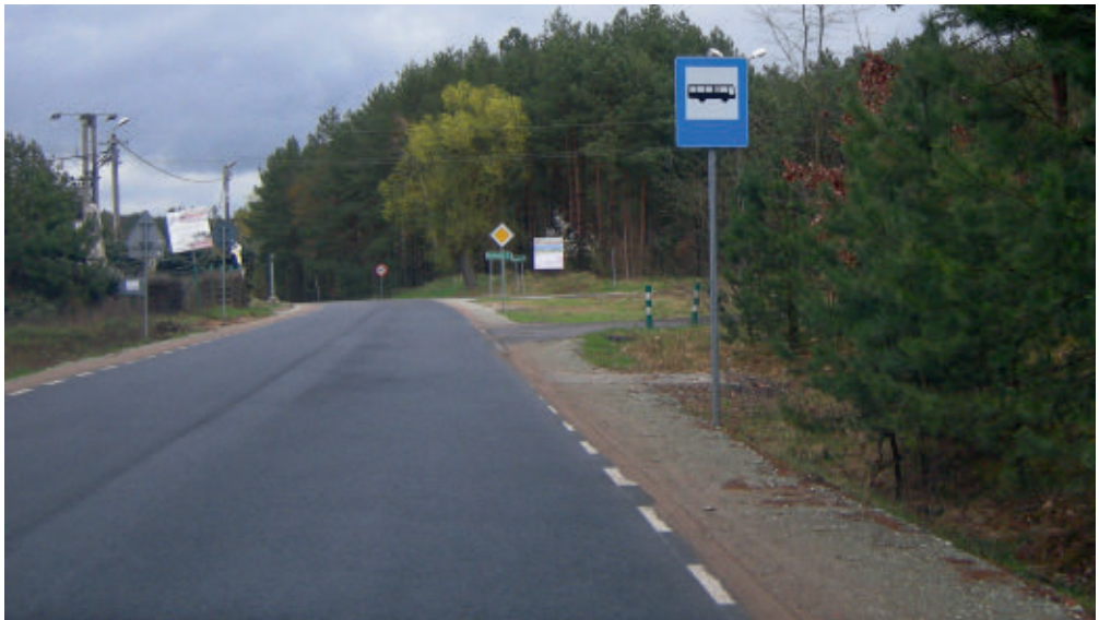
Przystanek autobusowy