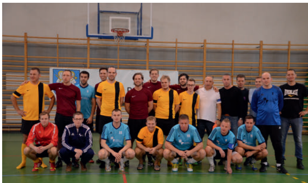
Samorządowcy z powiatu poznańskiego i Regionu Hanower na Turnieju Halowej Piłki Nożnej w Swarzędzu w 2016 roku

Od 2015 roku pracowników partnerskich urzędów integruje także inny projekt – regularne turnieje halowej piłki nożnej samorządowców. Wiosną drużyna piłkarska reprezentująca powiat poznański zapraszana jest do udziału w turnieju, który odbywa się w miejscowości Garbsen-Berenbostel. Z kolei jesienią zawody w hali sportowej Zespołu Szkół nr 1 w Swarzędzu organizuje powiat poznański. Spotkania te, poza rywalizacją spor-