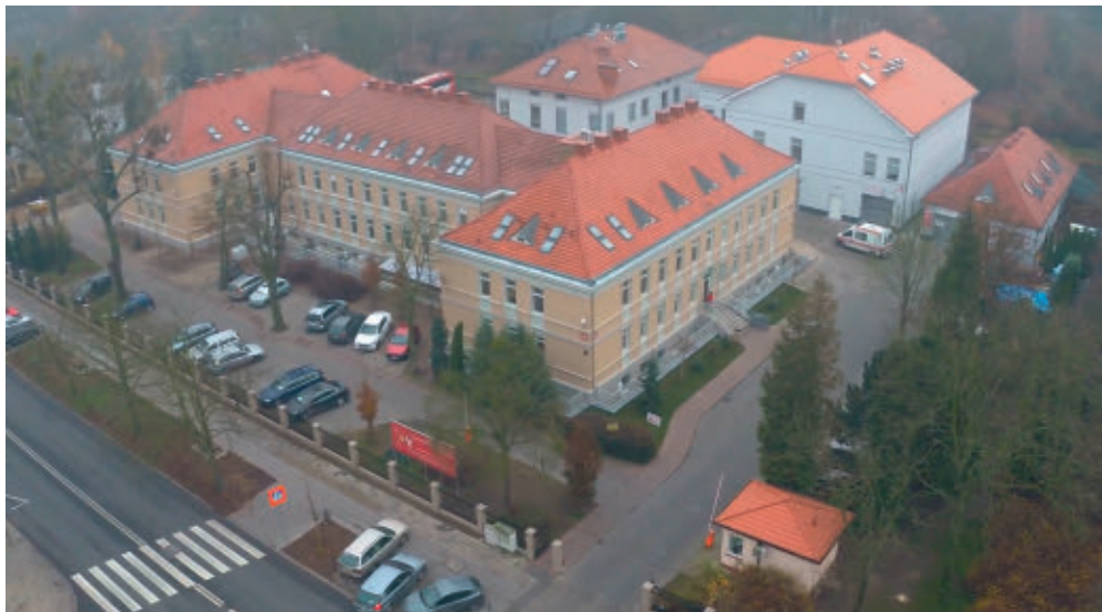
Siedziba RCKiK w Poznaniu

Dzięki sprawnie prowadzonej akcji promocyjnej niesłabnącą popularnością cieszą się akcje poboru krwi organizowane w wielu okolicznych miejscowościach. Ich organizacja jest coraz sprawniejsza. Z Centrum w Poznaniu wyruszają ekipy wyjazdowe pracujące cały tydzień, a zdarza się, że wyjeżdżają one na dwie kilkugodzinne akcje dziennie. Obecnie poznańskie krwiodawstwo obsługiwane jest przez cztery nowoczesne ambulanse do poboru krwi, zwane popularnie „krwiobusami”. Przyjeżdżają one pod szkoły, hipermarkety, na rynki miast i miasteczek. Pojawiają się również w miejscach, gdzie odbywają się festyny, zloty czy koncerty, często organizowane pod egidą klubów HDK oraz władz samorządowych. Doskonałym przykładem takich działań jest aktywność mieszkańców 17 gmin powiatu poznańskiego w 2019 roku. W 31 miejscowościach powiatu krwiobusy odwiedziło 3903 osób ze wszystkich przedziałów wiekowych. Wynik przeprowadzonych zbiórek był imponujący. Zebrano ponad 1717 l krwi 14 .