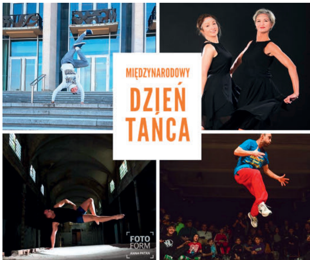
Międzynarodowy Dzień Tańca online projekt Zuzanna Olszewska-Chomicz

Początek kwietnia – moment, w którym mnóstwo osób zamiast do swojego miejsca pracy wybrało się do drugiego pokoju – to dosłownie oblężenie Internetu. Do tego stopnia, że bywały dni, w których zawieszał się nawet serwis YouTube. O platformach takich jak Zoom, ClickMeeting czy Jitsi – nie wspominając. Trudno było mówić o jakichkolwiek działaniach kulturalnych w momencie, w którym trzeba było zorganizować swoje życie na nowo.