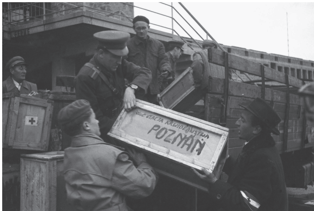
Rozładunek pojemników z krwią na lotnisku w Budapeszcie, koniec października 1956 r.

Ukoronowaniem pierwszej dekady działalności Stacji były wydarzenia z przełomu października i listopada 1956 roku. W związku z apelem Węgierskiego Czerwonego Krzyża o oddawanie krwi dla Węgrów, nadanym przez Polskie Radio, przed punktami krwiodawstwa w całym kraju ustawiły się kolejki ofiarnych dawców. Osoby oddające krew, poza nielicznymi wyjątkami, często czyniły to po raz pierwszy i ostatni w życiu. Był to przejaw powszechnej sympatii dla Węgrów walczących o niepodległość. Do Stacji Krwiodawstwa w Poznaniu poznaniacy stawiali się już w piątek 26 października. Następnego dnia samorzutnie zgłosiło się około 200 osób. W niedzielę także odebrano krew od kilkudziesięciu dawców, w tym od pracowników służby zdrowia i studentów. Po apelu PCK ogłoszonym przez Rozgłośnie Poznańską Polskiego Radia w poniedziałek 29 października Stacja Krwiodawstwa zapełniona była dawcami do późnych godzin wieczornych. W tym dniu dwoma samolotami wysłano z lotniska Ławica dwadzieścia dużych skrzyń zawierających krew, suchą plazmę oraz glukozę. Trafiały one do Instytutu Hematologii w Warszawie,