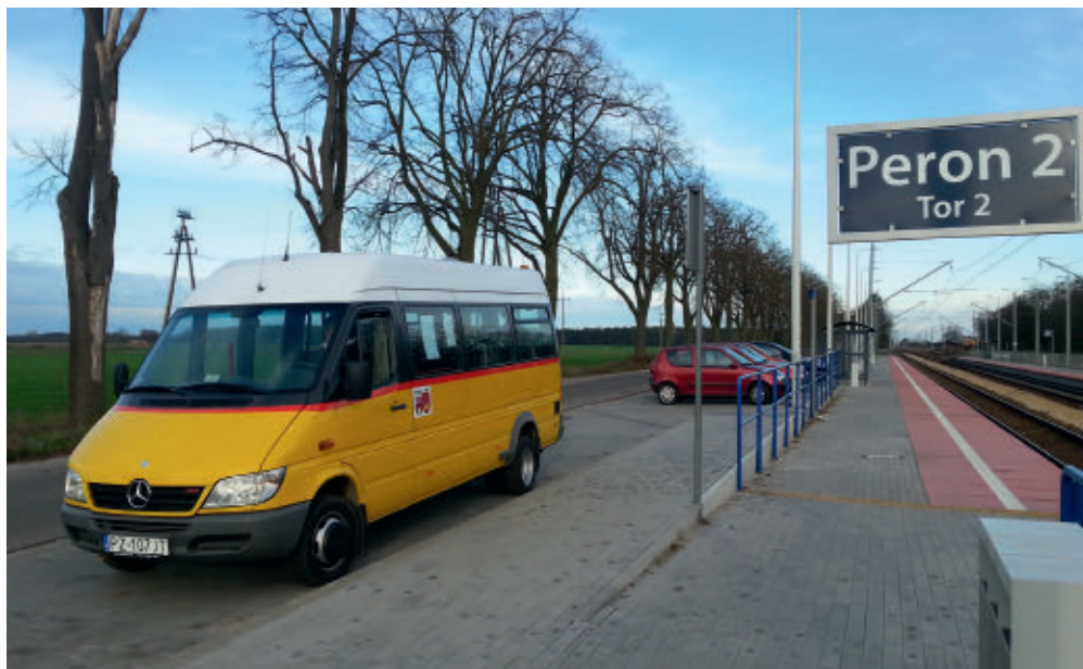
Węzeł przesiadkowy w Kórniku

Aby stworzyć odpowiednie warunki funkcjonowania transportu publicznego, należy ściśle zdefiniować czynniki stanowiące główne bariery korzystania z niego. Warto uwzględnić tu znaczne zróżnicowanie poziomu zagospodarowania przestrzennego. Wspomniane blisko 400 tysięcy ludzi zamieszkuje 363 miejscowości rozrzucone na obszarze 1900 km 2 . W związku z powyższym na terenie naszego powiatu są takie miasta