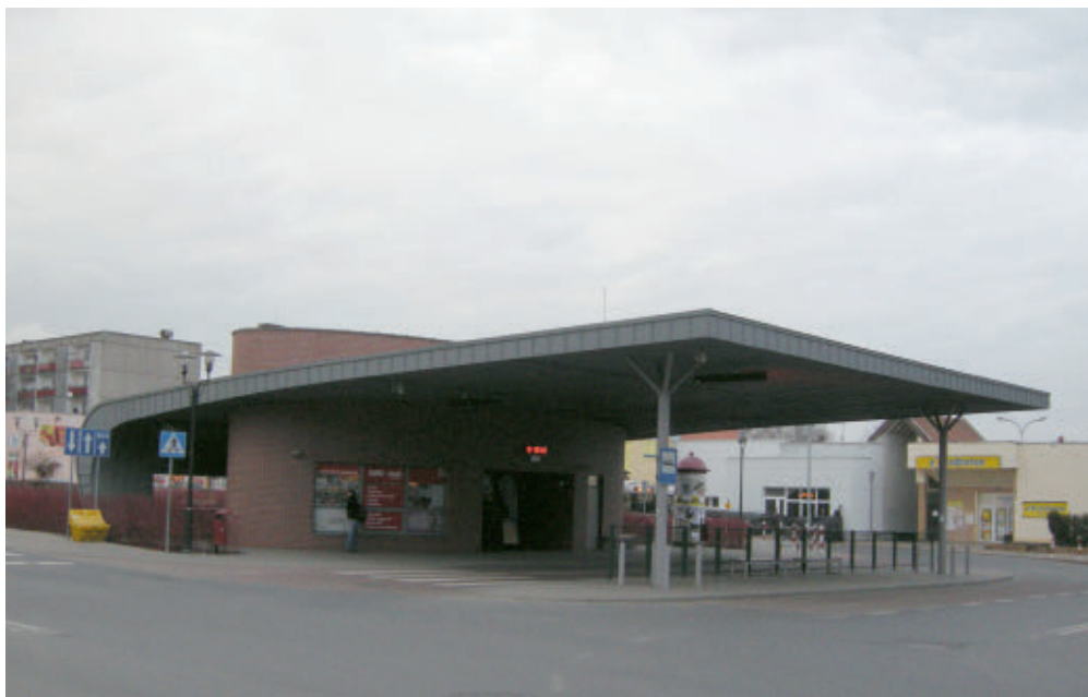
Dworzec przesiadkowy w Swarzędzu na os. Kościuszkowców

Co zatem można zrobić, aby transport publiczny stał się bardziej przyjazny dla mieszkańców powiatu? Puśćmy wodze fantazji i wymyślmy system, który byłby w stanie spełnić oczekiwania wszystkich. Próba kopiowania rozwiązań stosowanych w Poznaniu jest skazana na niepowodzenie, gdyż z uwagi na uwarunkowania przestrzenne system taki byłby