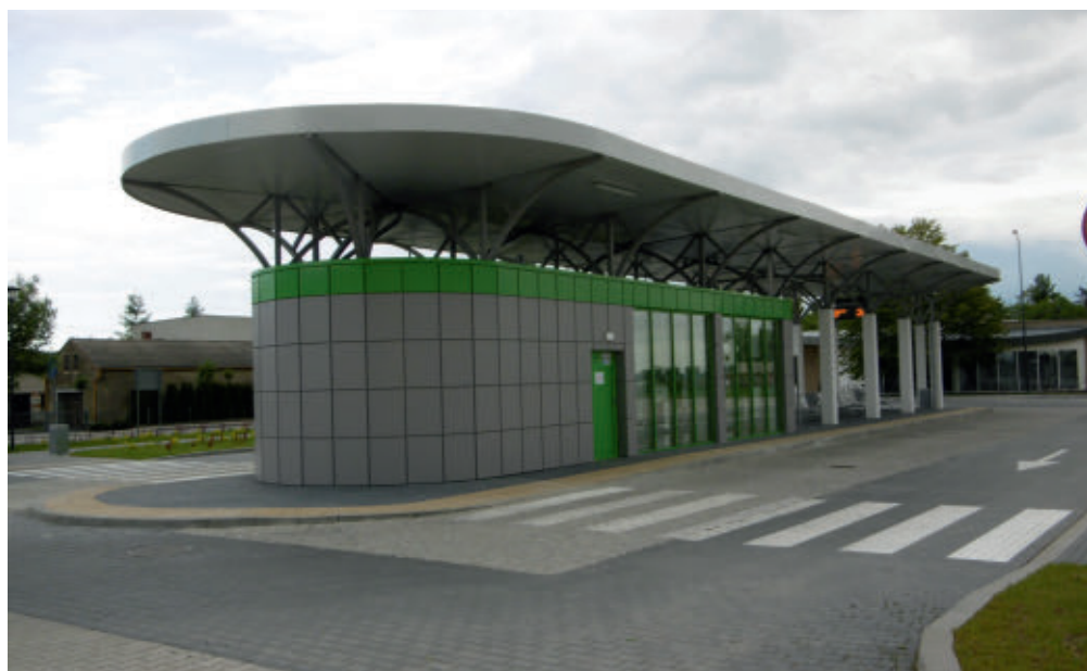
Węzł przesiadkowy w Kleszczewie

jak Swarzędz, gdzie gęstość zaludnienia wynosi ponad 3 tys. osób/km 2 , oraz wsie, gdzie nie przekracza ona 50 osób/km 2 . To pokazuje, jak trudno stworzyć system transportowy oferujący takie same standardy na całym obszarze powiatu. Co więcej, przyjęcie identycznych standardów dla wszystkich linii spowodowałoby przewymiarowanie systemu, co w efekcie końcowym wpływałoby na zbyt wysokie koszty jego utrzymania oraz zbyt dużą emisję CO 2 w przeliczeniu na jednego pasażera. Dodatkowe problemy powoduje dynamiczny rozwój intensywnej zabudowy mieszkaniowej na obszarach wiejskich. O ile kilka lat temu przeważała tam zabudowa jednorodzinna, lokowana w bezpośrednim sąsiedztwie dróg, o tyle obecnie we wsiach powstają coraz większe osiedla szeregowców, coraz bardziej oddalone od przystanków autobusowych, zabudowane tak gęsto, że nie ma możliwości doprowadzenia w ich sąsiedztwo nowych linii autobusowych, nawet takich, które można by obsługiwać minibusami. To bardzo poważne ograniczenie infrastrukturalne w rozwijaniu sieci komunikacyjnej.