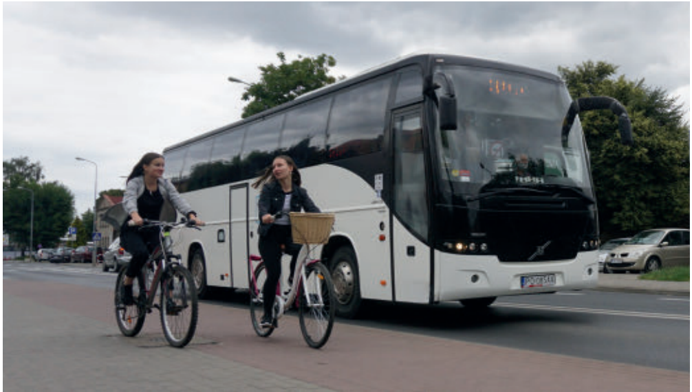
Volvo 9700, PKS Poznań