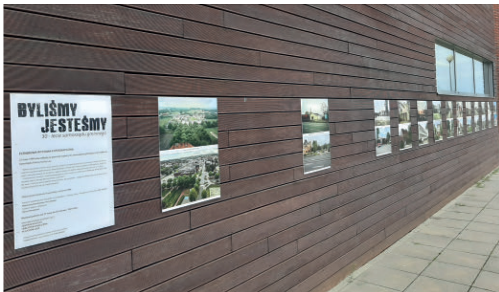
Budynek CKiBP w Suchym Lesie z widoczną wystawą „Byliśmy – Jesteśmy” na 30-lecie samorządu gminnego