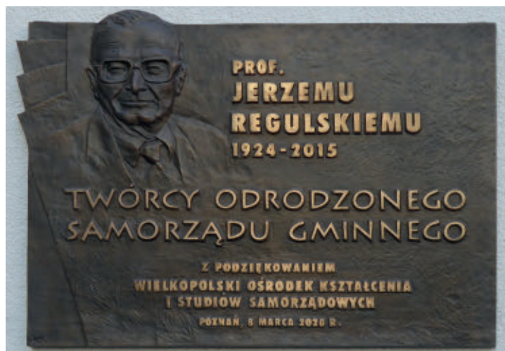
Tablica ku czci prof. Regulskiego fol. Sylwia Stręk