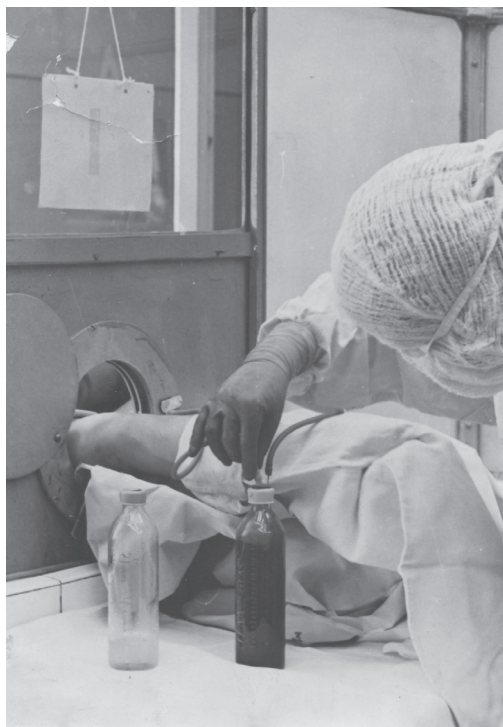
Boks do pobierania krwi, 1953 r.

Do istotnej zmiany administracyjnej doszło w Wojewódzkiej Stacji Krwiodawstwa w Poznaniu w grudniu 1950 roku, kiedy to na mocy okólnika Ministerstwa Zdrowia została ona włączona pod bezpośredni zarząd tego organu. Odtąd finansowana była przez Wydział Zdrowia Wojewódzkiej Rady Narodowej w Poznaniu. Od 1951 roku poznańska Stacja otrzymywała roczny plan poboru krwi. Pierwszy „plan produkcyjny” określił tę liczbę na 6000 l w ciągu roku. Przydzielał również odpowiednie środki finansowe. Pod względem merytorycznym Stacja podlegała Instytutowi