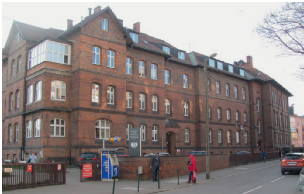
Dawny budynek Stacji Krwiodawstwa przy ul. Jackowskiego 42

w których urządzono: kancelarię, salę zabiegową, laboratorium i gabinet lekarski. Pracowało w niej dwóch lekarzy – internista i serolog, oraz dwie laborantki. Już wtedy czynna ona była całą dobę.