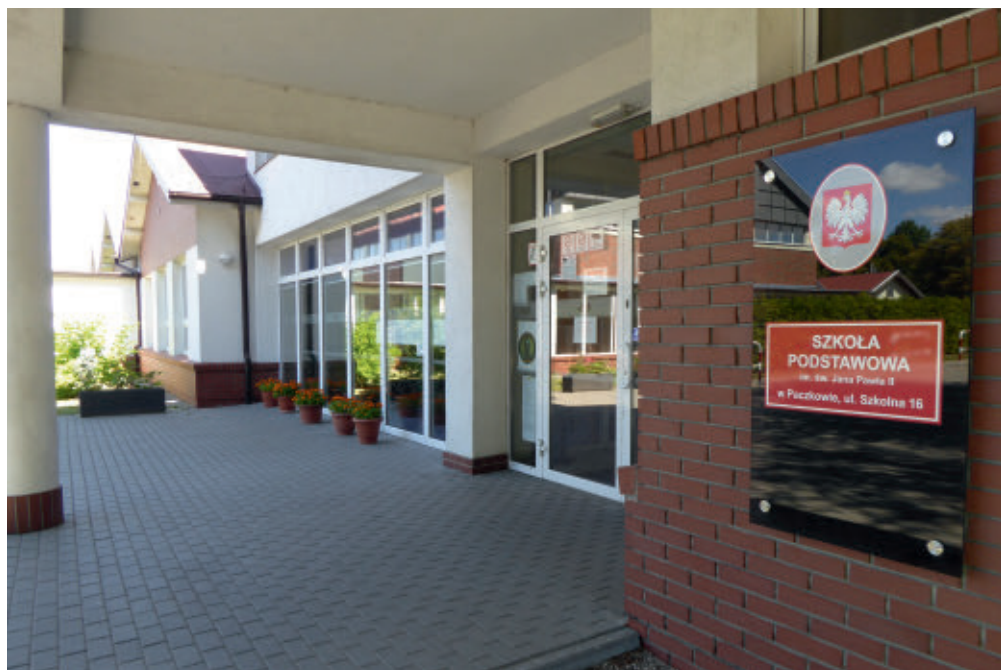
Szkoła Podstawowa im. św. Jana Pawła II w Paczkowie

Pierwsza spośród szkół noszących imię Jana Pawła II położona jest w Paczkowie w gminie Swarzędz. Historia szkolnictwa w tej miejscowości sięga okresu zaborów. To w 1904 roku w Paczkowie powstał pierwszy budynek szkolny, przeznaczony dla Niemców wyznania ewangelickiego. Po odzyskaniu niepodległości przez Polskę w 1922 w Paczkowie powstała szkoła katolicka. Placówka wielokrotnie zmieniała lokalizację: początkowo zajmowała budynek przy ulicy Szkolnej 14, następnie od lat 50. XX w. podworski budynek przy ulicy Dworskiej. Rok szkolny 2013/2014 został zainicjowany w nowym, nowoczesnym budynku przy ulicy Szkolnej 16, gdzie do użytku uczniów zostały oddane sale z tablicami interaktywnymi, stołówką, szafkami oraz w pełni wyposażoną pracownią komputerową. W latach 2004–2017 szkoła funkcjonowała jako Zespół Szkół składający się ze Szkoły Podstawowej i Gimnazjum. Po reformie edukacji i likwidacji