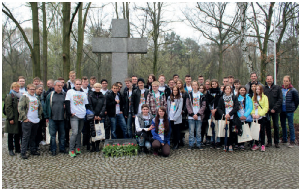
Uczniowie szkoły Justus von Liebig Schule w Hanowerze i ZS nr 1 w Swarzędzu na cmentarzu w Poznaniu, w ramach działania „Praca dla pokoju – pojednanie nad grobami” w 2016 roku

środowiska. Problem okazał się bardzo ważny, ale nie udało się go wtedy rozwiązać ani wypracować wspólnego stanowiska. Dopiero w 2007 roku wraz z miastem Poznań podjęto działania na rzecz stworzenia Związku Międzygminnego „Gospodarka Odpadami Aglomeracji Poznańskiej”. Była to konsekwencja podpisania w maju 2007 roku porozumienia „Agglomeracja Poznańska jest po twojej stronie” – projektu, który kilka lat później przekształcił się w Stowarzyszenie Metropolia Poznań.