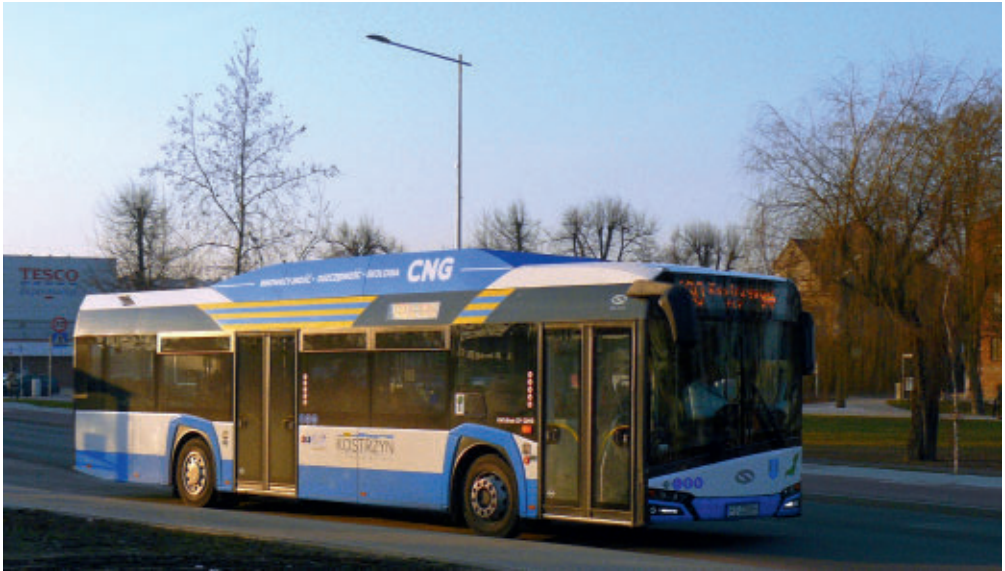
Gazowy Solaris Urbino w barwach KKP Kostrzyn