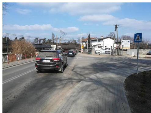
Zdjęcie: AXIAL Project Bartosz Tomczak / Koncepcja projektowa