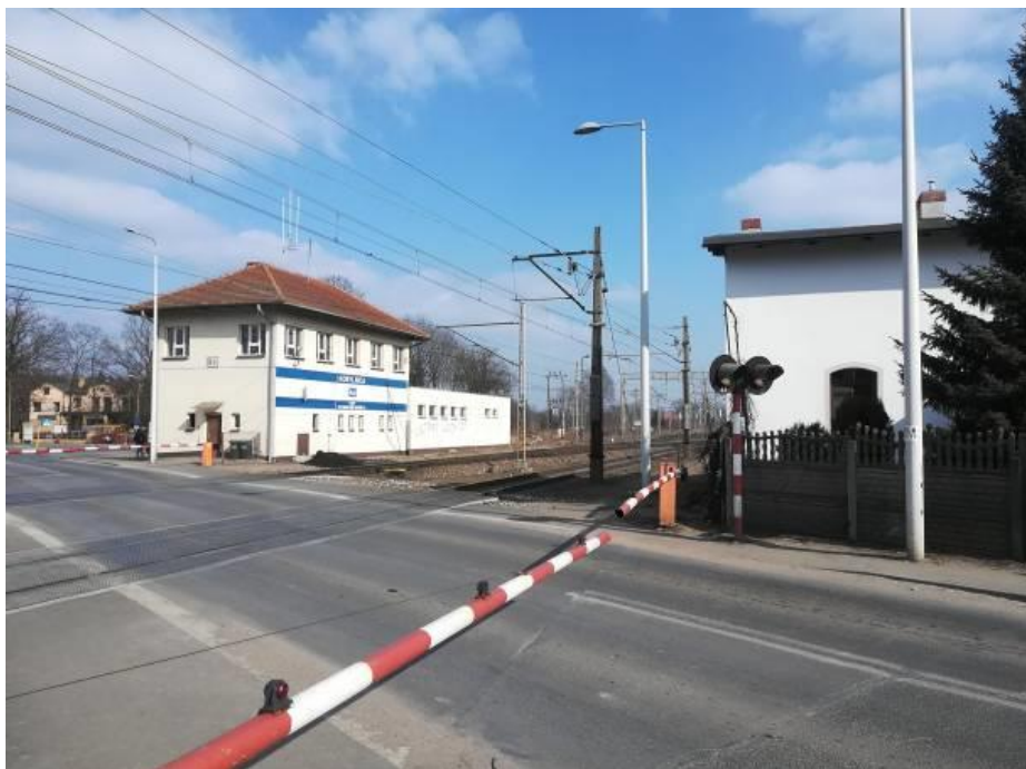
Zdjęcie: AXIAL Project Bartosz Tomczak / Koncepcja projektowa