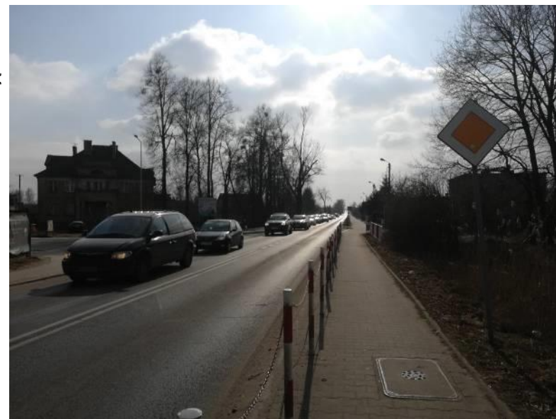
Zdjęcie: AXIAL Project Bartosz Tomczak / Koncepcja projektowa