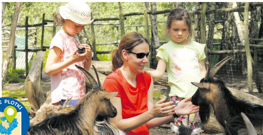
Zwierzęta w Traperskiej Osadzie

Kolorowe mieszkanki egzotycznych krain można podziwiać (a nawet samodzielnie nakarmić) w Papugarni Ara w Trzebawiu. Naukę rodzimych gatunków warto rozpocząć od wizyty na wieży ornitologicznej przy Trzcielińskim Bagnie. Tamtejsze tablice edukacyjne ze świetnymi rysunkami pomogą rozpoznać obserwowane ptaki – na przykład żurawia i wilgę, które stały się pierwowzorami maskotek Gminy Dopiewo. Jedną z największych atrakcji Parku Dzieje w Murowaniej Goślinie jest widowisko z udziałem drapieżnych ptaków oraz pokazy sokolnicze. Imitacja gniazda bielika to miejsce, w któ-