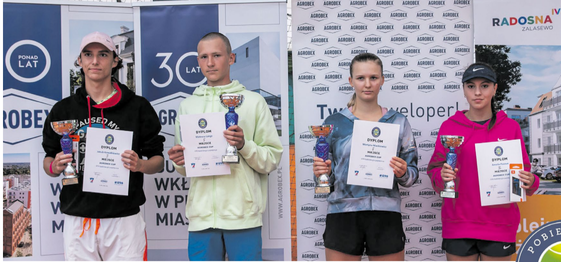
Najlepsi kadeci Ogólnopolskiego Turnieju Kwalifikacyjnego w Pobiedziskach

Z czasem znaleźliśmy ślady tych kortów. One były położone w miejscu, w którym później powstała „krajowa 5”. W czasie okupacji, Niemcy budując drogę, zasypali je. Pozostałości po innych kortach odkryliśmy też przy byłym liceum prowadzonym przez Klasztor Sióstr Sacré Coeur. To tylko pokazuje, że biały sport był w Pobiedziskach przed wojną bardzo popularny.