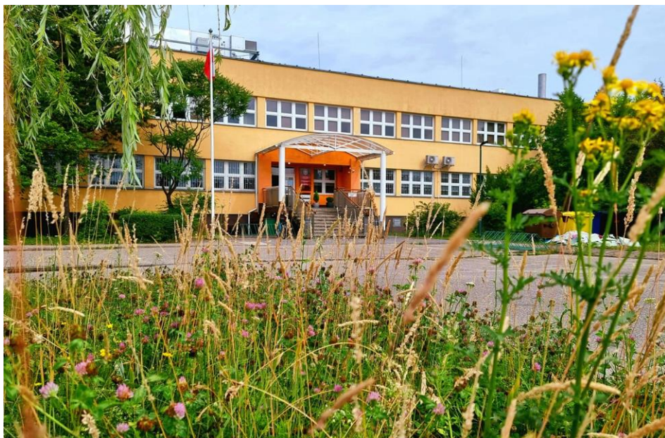
Szkoła w Bolechowie