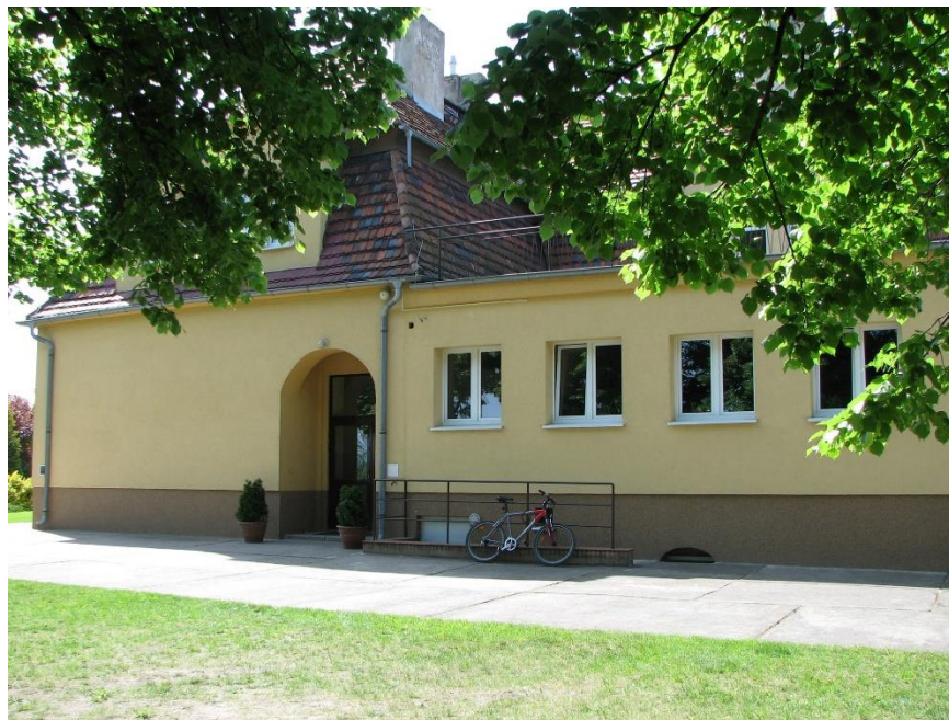
Szkoła w Poznaniu