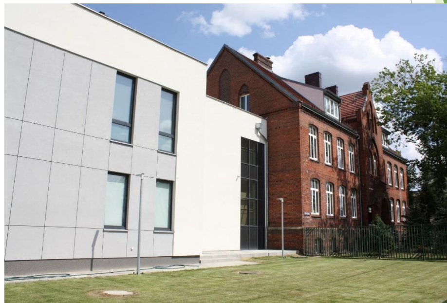
Szkoła w Murowanej Goślinie + LO dla dorosłych