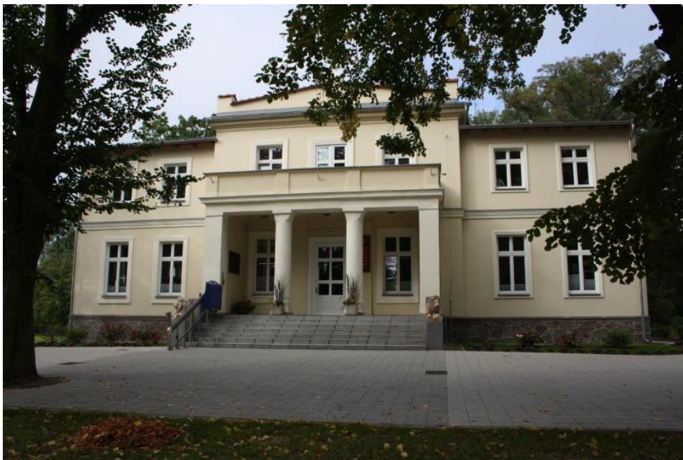
Szkoła w Rokietnicy