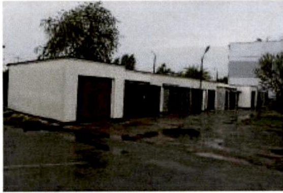
Widok na dz. 222/159