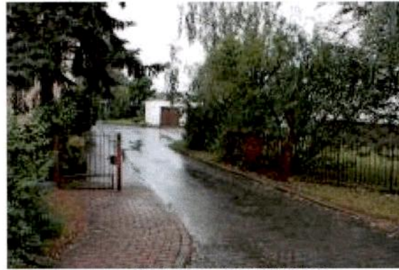
Widok na dz. 222/115

Dane dotyczące nieruchomości położonych w Baranowie ul. Budowlanych 9 oraz warunki przetargu: