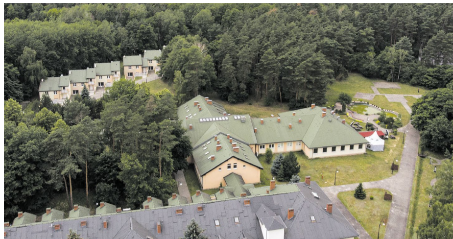
Dom Pomocy Społecznej w Lisówkach dysponuje szeroką ofertą usług. W Lisówkach działa też pierwszy w Wielkopolsce dom dla samotnych rodziców z dziećmi

Dom Pomocy Społecznej w Lisówkach dysponuje szeroką ofertą usług skierowaną do seniorów wymagających pomocy instytucjonalnej. Dom świadczy całodobowe, kompleksowe usługi opiekuńcze, pielęgnacyjne i wspomagające. Od pewnego czasu działa tam również, pierwszy w Wielkopolsce, dom dla samotnych rodziców z dziećmi. Osoby tam trafiające mogą liczyć nie tylko na schronienie, ale także na pomoc psychologiczną, socjalną czy prawną. Chcemy dać im szansę na nowy początek, z dala od toksycznego środowiska, w którym zazwyczaj żyją. Decyzja o powstaniu takiego miejsca to kolejny element polityki społecznej, na którą w powiecie poznańskim kładziemy bardzo duży nacisk.