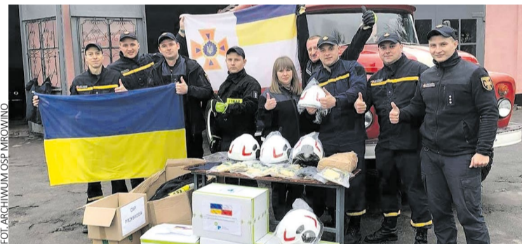
Strażacy z Ukrainy z darami z powiatu poznańskiego

Powiat poznański oraz strażacy z powiatowych jednostek wsparli swoich kolegów z Ukrainy, a konkretnie z jednostek w miejscowościach Tomakiwka oraz Marganiec w obwodzie dniepropietrowskim.