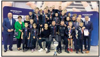
Zapaśnicy Unii Swarzędz

w sprincie drużynowym oraz w rywalizacji na kilometr ze startu zatrzymanego.