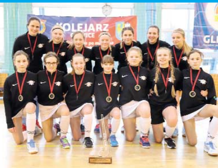
Halowe mistrzyni Polski junierek młodszych