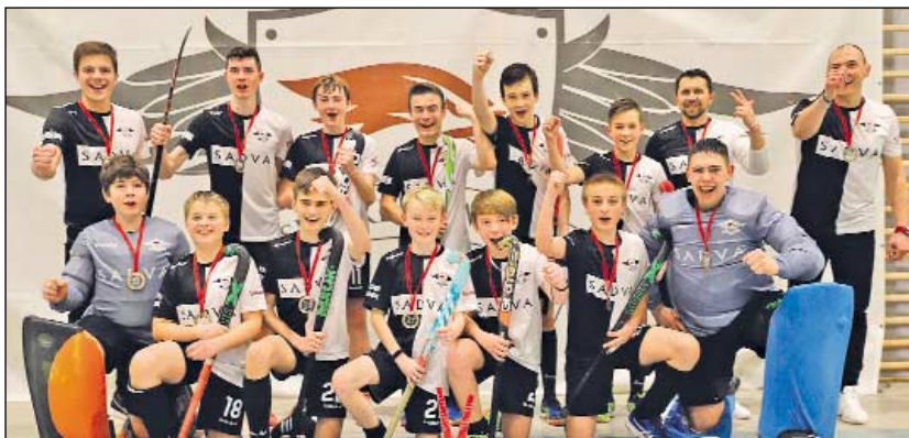
Złota drużyna juniorów młodszych

UKS SP5 Swarerek to obecnie najbardziej dynamicznie rozwijający się klub hokeja na trawie w naszym kraju. Rok 2021 dla młodzieżowych drużyn ze Swarzędza był niekończącym się pasmem sukcesów, a ich dorobek medalowy jest wprost imponujący.