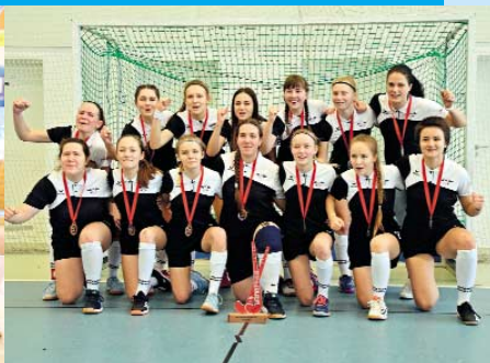
Halowe mistrzyni Polski junierek