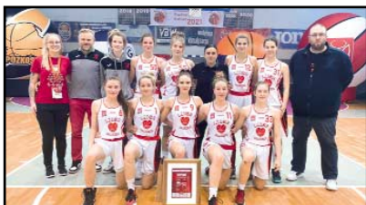
Juniorki starsze Lidera Swarzędz