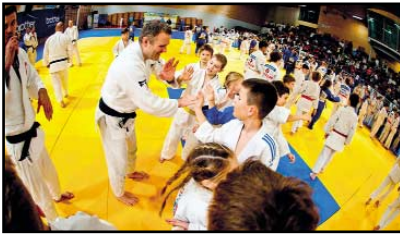
Brother Olympic Camp