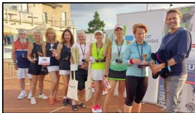
Turniej o Puchar Starosty Poznańskiego