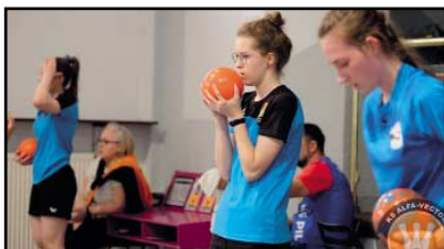
Zawodniczki Alfy-Vector Tarnowo Podgórne