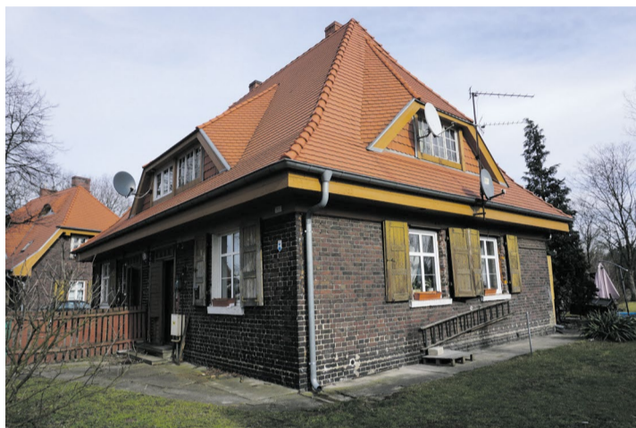
Dom mieszkalny Kolonii Poznańskich Zakładów Nawozów Fosforowych (blok nr 3) w Luboniu może liczyć na remont

W tym roku, tak jak i w latach ubiegłych, o dofinansowanie mogły się ubiegać obiekty wpisane do rejestru zabytków lub znajdujące się w gminnej ewidencji zabytków, położonych na terenie powiatu poznańskiego. – W sumie wpłynęło do nas 40 wnio-