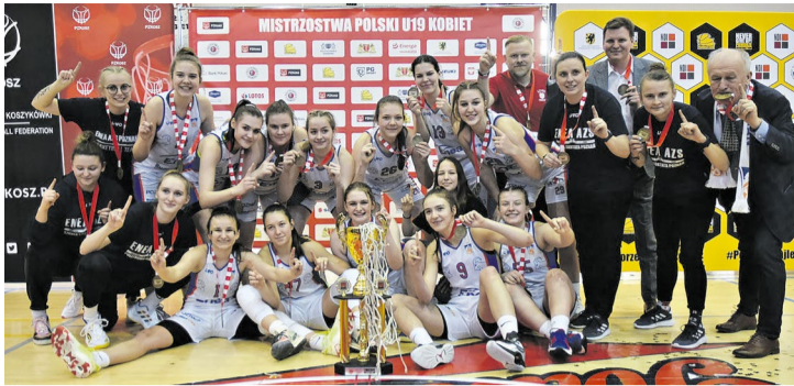
Juniorki Lidera Swarzędz zostały najlepszą drużyną w Polsce