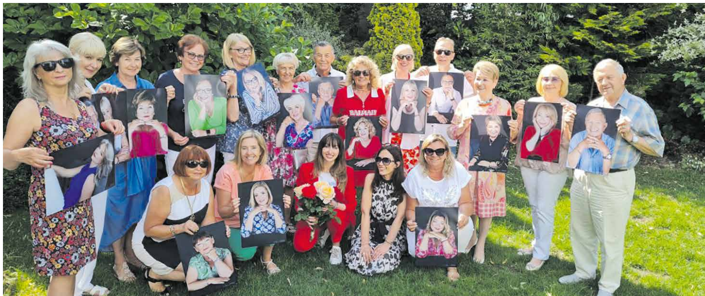
FOT.FUNDACJA „NIGDY NIE JEST ZA PÓŹNO”