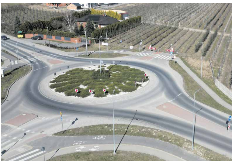
W tym miejscu będzie zaczynała się obwodnica Swarzędza.

P owiat poznański otrzymał ponad 15,5 mln zł rządowego dofinansowania na realizację zadania pn. „Budowa obwodnicy Miasta Swarzędza”. Umowę w tej sprawie podpisali Agata Sobczyk, wojewoda wielkopolska wraz z wóldarzami powiatu poznańskiego. To inwestycja, której od lat wyczekują mieszkańcy. Dzięki środkom z Rządowego Funduszu Rozwoju Dróg jej realizacja jest coraz bliżej.