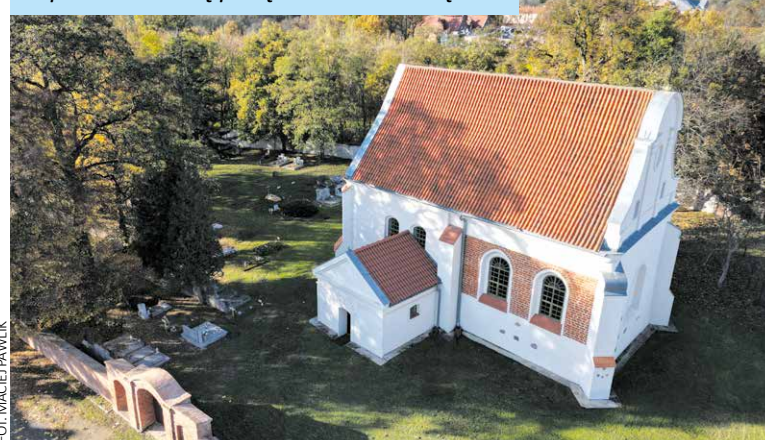
Kościół pochodzi z XVI wieku i dzięki dotacji powiatu stał się perłą architektoniczną.

poszycia dachowego zabytkowej hali produkcyjno-magazynowej autorstwa Hansa Poelziga w Lubiniu. Nowy dach ma zyskać również dawna gorzelnia, a obecnie budynek mieszkalny w Szczodrzykowie, gm. Kórnik. Wśród beneficjentów są także m.in. Biblioteka Kórnicka