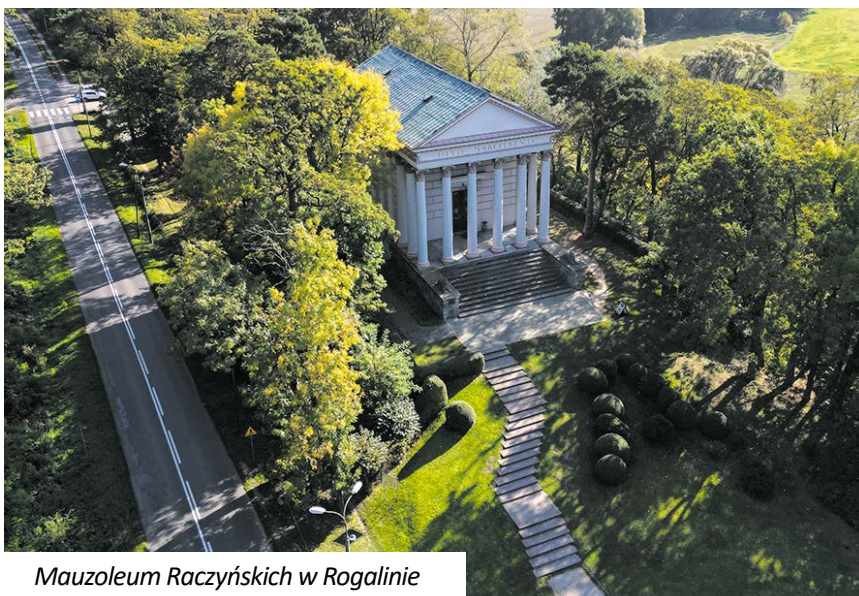
Mauzoleum Raczyńskich w Rogalinie

172 – tyle schodów trzeba pokonać, aby wejść na wieżę widokową na Dziewiczej Górze.