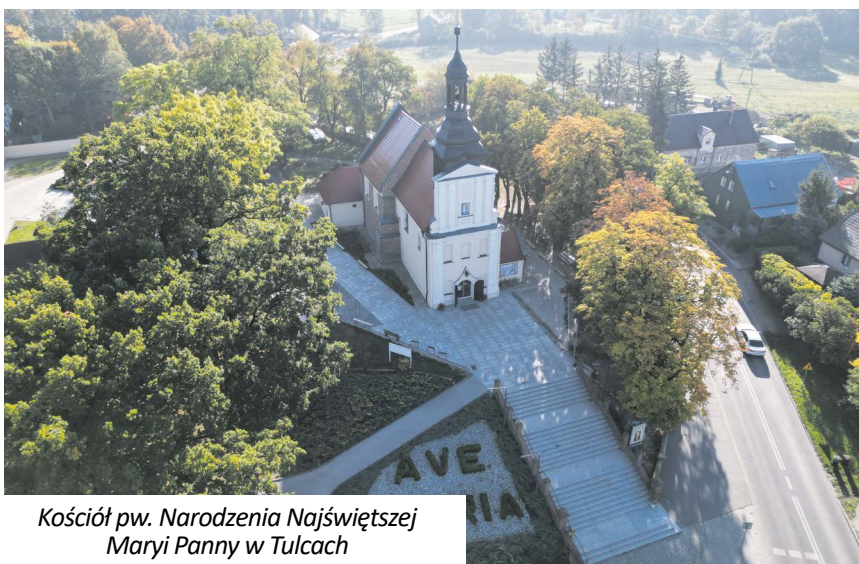
Kościół pw. Narodzenia Najświętszej Maryi Panny w Tulcach