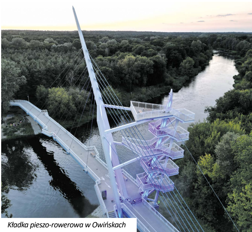
Kładka pieszo-rowerowa w Owińskach