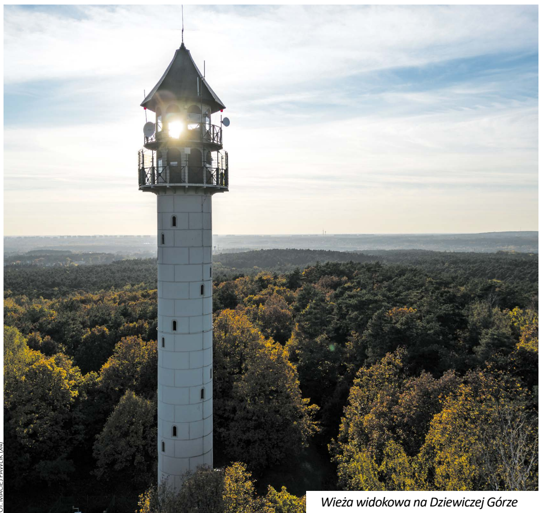
Wieża widokowa na Dziewiczej Górze